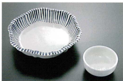
9-752-7 ¥4,600 桔梗淵向付古染木草 (有田焼) 陶 175×165×40 8-752-27 9-752-8 ¥1,400 太白千代口 (有田焼) 陶 φ74×35 8-752-28