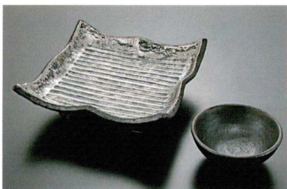
9-752-5 ¥4,700 黒銀彩角皿 (有田焼) 陶 150×150×50 8-752-25 9-752-6 ¥1,950 黒土楽大千代口 (有田焼) 陶 φ80×32 8-752-26