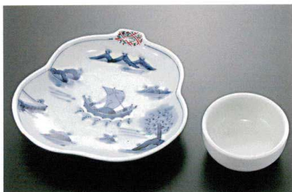
9-752-1 ¥4,600 ひさご平向付古染山水 (有田焼) 陶 160×165×30 8-752-21 9-752-2 ¥1,400 太白千代口 (有田焼) 陶 φ74×35 8-752-22