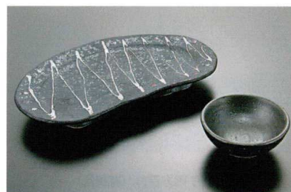
9-752-9 ¥3,900 黒しぼり変型平皿 (有田焼) 陶 220×130×25 8-752-29 9-752-10 ¥1,950 黒土楽大千代口 (有田焼) 陶 φ80×32 8-752-30