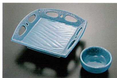
9-752-15 ¥4,800 トルコ釉白吹スカン高台角皿 (有田焼) 陶 170×170×50 8-752-35 9-752-16 ¥1,150 トルコ青千代口 (有田焼) 陶 φ74×34 8-752-36