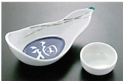
9-752-3 ¥4,600 長ひさご向付福字 (有田焼) 陶 210×120×70 8-752-23 9-752-4 ¥1,400 太白千代口 (有田焼) 陶 φ74×35 8-752-24