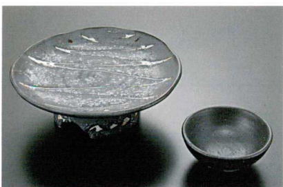
9-752-11 ¥3,900 黒しぼり三ツ足高台皿 (有田焼) 陶 φ160×55 8-752-31 9-752-12 ¥1,950 黒土楽大千代口 (有田焼) 陶 φ80×32 8-752-32