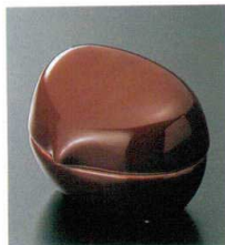
9-779-18 ¥500 栗珍味 陶 56×45×40 8-779-18