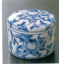
9-779-4 ¥1,380 丸蓋付珍味入 蓮花唐草 陶 φ61×48 8-779-4