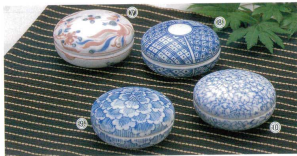
越南陶器珍味入 陶 9-779-7 花鳥 ¥1,000 φ75×40 8-779-7 9-779-8 祥瑞 ¥1,000 φ75×40 8-779-8 9-779-9 ほたん ¥1,000 φ75×40 8-779-9 9-779-10 京小花 ¥1,000 φ75×40 8-779-10