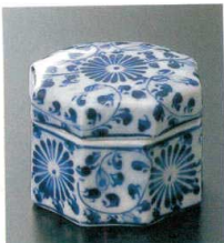
9-779-2 ¥1,100 八角蓋付珍味入 菊唐草 陶 φ59×45 8-779-2