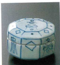
9-779-1 ¥780 八角蓋付珍味入 像形 陶 φ60×40 8-779-1