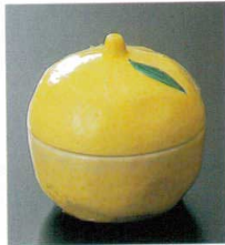
9-779-19 ¥600 柚子珍味 陶 φ50×50 8-779-19