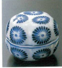
9-779-5 ¥1,100 花型蓋付珍味入 菊紋 陶 φ61×53 8-779-5