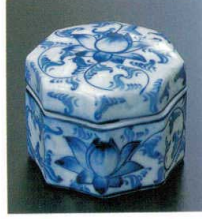
9-779-6 ¥1,100 八角蓋付珍味入 蓮花唐草 陶 φ59×45 8-779-6