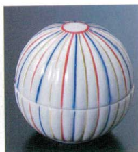
9-779-14 ¥800 まり十草珍味 陶 φ65×6 8-779-14