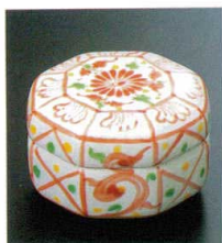
9-779-17 ¥1,250 八角蓋付珍味入 赤絵唐草 陶 φ60×43 8-779-17