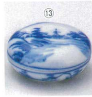
9-779-11 タコ唐草 ¥1,000 φ75×40 8-779-11 9-779-12 なじり祥瑞 ¥1,000 φ75×40 8-779-12 9-779-13 山水 ¥1,000 φ75×40 8-779-13