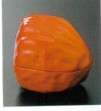
9-779-22 ¥600 ほおつき珍味 陶 56×46×49 8-779-22