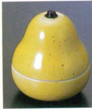
9-779-16 ¥800 洋梨珍味 陶 φ57×64 8-779-16