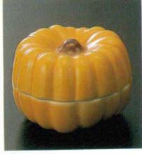
9-779-21 ¥800 かぼちゃ珍味 陶 φ59×40 8-779-21