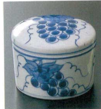
9-779-3 ¥1,380 丸蓋付珍味入 葡萄 陶 φ61×48 8-779-3