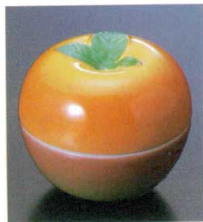
9-779-15 ¥800 オレンジ珍味 陶 φ55×47 8-779-15