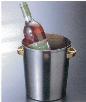
9-889-13 ¥13,500 ステンレスワインクーラー ビバ (530) ST φ183×200 8-889-13