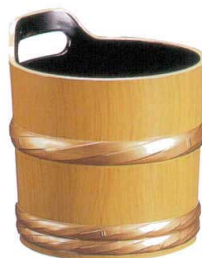
9-889-9 ¥3,350 手桶型ワインクーラー 白木塗 M φ160×150 8-889-9