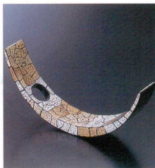
9-889-1 ¥4,500 木製ワインロックングラック 貝貼り 困 275×52 8-889-1