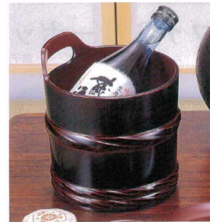
9-889-10 ¥14,000 手桶型ワインクーラー 漆溜 M φ160×150 8-889-10