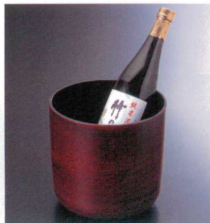
9-889-8 ¥5,800 18cm ワインクーラー 漆刻 M 180×180×170 8-889-8