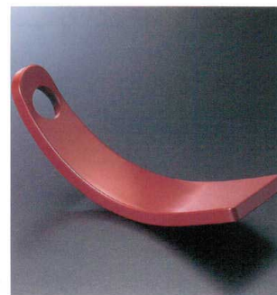
9-889-2 ¥3,500 ワインロックングラック 吟朱 困 290×88 (50) 8-889-2