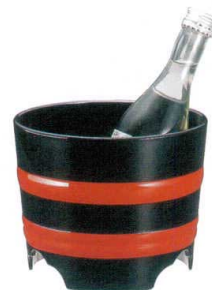
9-889-6 ¥2,950 和風桶型ワインクーラー 黒に朱ひも A φ175×137 8-889-6