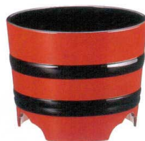
9-889-5 ¥2,950 和風桶型ワインクーラー 朱に黒ひも A φ175×137 8-889-5