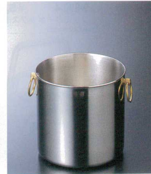
9-889-14 ¥9,000 ステンレスワインクーラー パブ (459) ST φ150×145 8-889-14