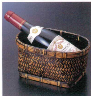
9-889-7 困 ¥4,400 籠ワインクーラーボックス (水もれ防止内面漆塗) 195×235×95 8-889-7