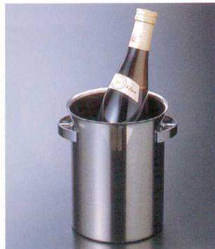
9-889-12 ¥10,000 ステンレスワインクーラー (440) ST φ147×180 8-889-12