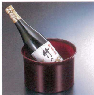
9-889-4 ¥7,400 冷酒クーラー 溜漆塗り 困 φ185×120 8-889-4