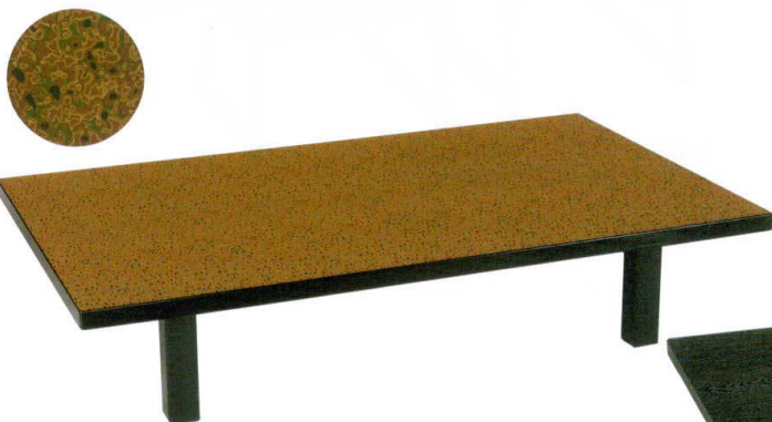
堆朱 (天板樹脂合板・折足) 困