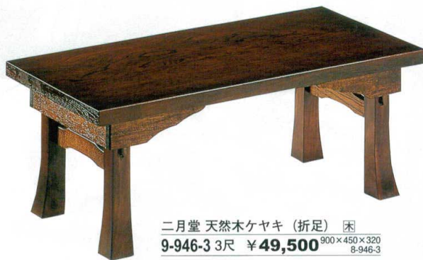
二月堂 天然木ケヤキ (折足) 困 9-946-3 3尺 ¥49,500 900×450×320 8-946-3