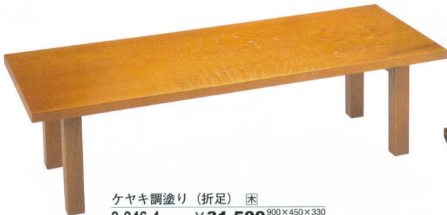
ケヤキ調塗り (折足) 困 9-946-4 ¥31,500 900×450×330 8-946-4 9-946-5 ¥37,500 1200×450×330 8-946-5 9-946-6 ¥48,500 1500×450×330 8-946-6