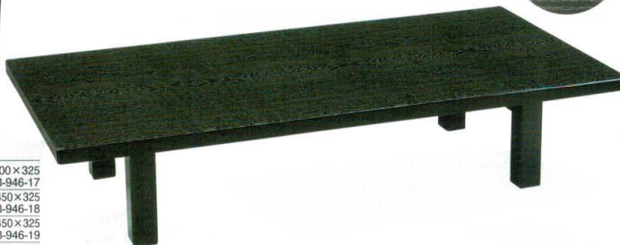
黒木目 (天板樹脂合板・折足) 困