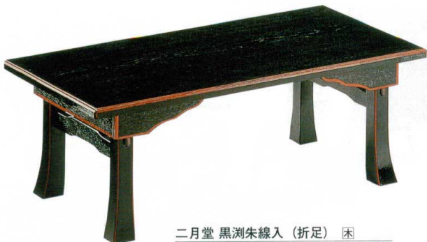
二月堂 黒澗朱線入 (折足) 困 9-946-1 3尺 ¥46,000 900×450×320 8-946-1 9-946-2 4尺 ¥59,500 1200×450×320 8-946-2