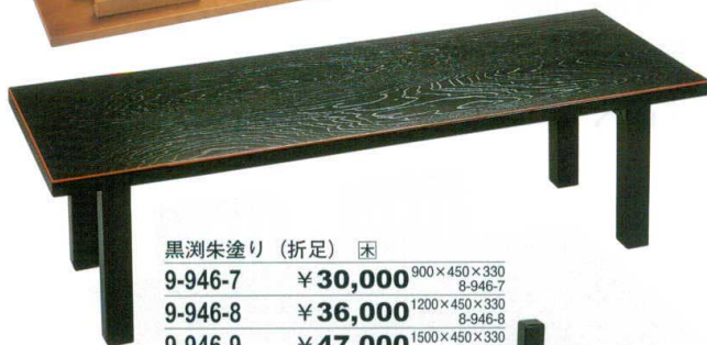
黒澗朱塗り (折足) 困 9-946-7 ¥30,000 900×450×330 8-946-7 9-946-8 ¥36,000 1200×450×330 8-946-8 9-946-9 ¥47,000 1500×450×330 8-946-9