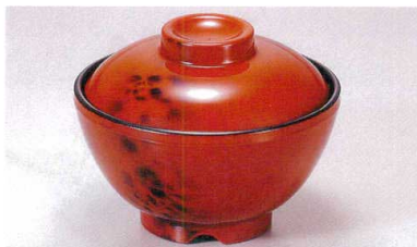
1139-1 TA 黄別甲内黒セット ¥3,400 (蓋) ¥1,400 (身) ¥2,000