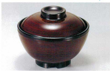
1139-6 TA 溜刷毛目内黒セット ¥4,000 (蓋) ¥1,600 (身) ¥2,400