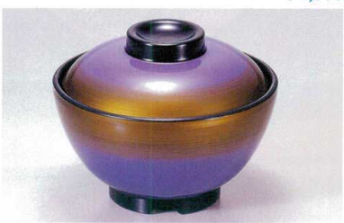
1139-7 TA 紫金かすみ内黒セット ¥4,000 (蓋) ¥1,600 (身) ¥2,400