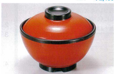
1139-11 TA 朱刷毛目内黒セット ¥4,200 (蓋) ¥1,700 (身) ¥2,500