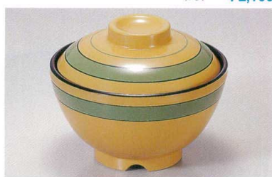
1139-5 TA クリーム独染内黒セット ¥3,800 (蓋) ¥1,500 (身) ¥2,300