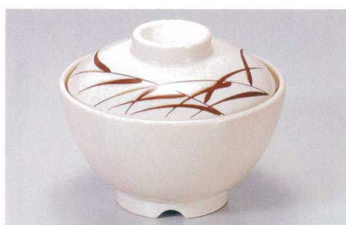
1139-3 TA アイボリーストーン芦セット ¥3,600 (蓋) ¥1,600 (身) ¥2,000