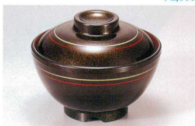
1139-8 TA 茶パール朱金ライン内朱セット ¥4,000 (蓋) ¥1,600 (身) ¥2,400