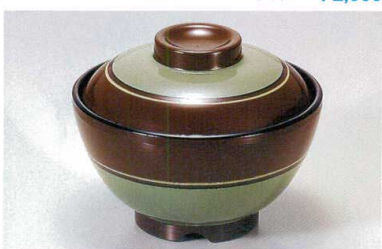
1139-4 TA ブラウン独染内黒セット ¥3,800 (蓋) ¥1,500 (身) ¥2,300