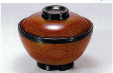
1139-12 TA 春慶刷毛目内朱セット ¥4,200 (蓋) ¥1,700 (身) ¥2,500