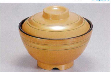
1139-13 TA ベージュパール緑金ライン内黒セット ¥4,200 (蓋) ¥1,700 (身) ¥2,500