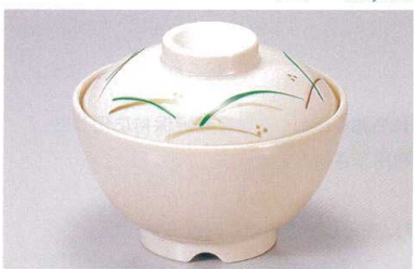
1139-9 TA アイボリーストーンつゆ草セット ¥4,100 (蓋) ¥2,100 (身) ¥2,000