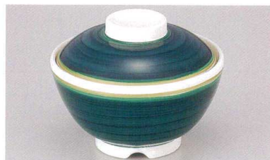
1139-2 TA 清流内ストーンセット ¥3,600 (蓋) ¥1,500 (身) ¥2,100