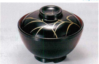
1139-10 TA 笹内朱セット ¥4,100 (蓋) ¥1,900 (身) ¥2,200