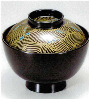
148-14 1-167-12 TA 新越前椀 金波 エース塗 ¥3,650 (11.1φ×9.7) 梱100