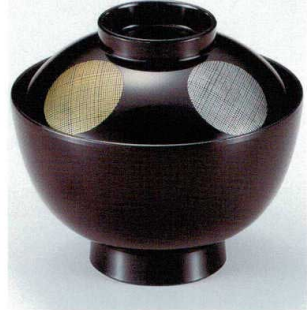
148-4 W-4-99 TA 新越前椀 黒日月 S・H塗 ¥2,600 (11.1φ×9.7) 梱100