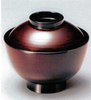
148-5 W-9-87 TA 新越前椀 溜刷毛目 ¥2,300 (11.1φ×9.7) 梱100