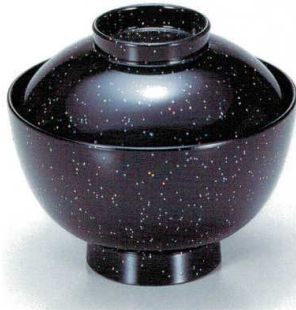
148-2 W-2-12 TA 新越前椀 青貝 ¥1,550 (11.1φ×9.7) 梱100