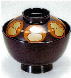
148-13 1-167-11 TA 新越前椀 六ひょうたん エース塗 ¥3,650 (11.1φ×9.7) 梱100