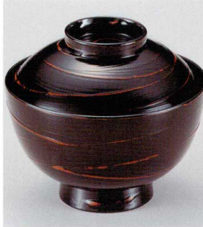
148-7 W-5-2 TA 新越前椀 渦曙 ¥3,000 (11.1φ×9.7) 梱100