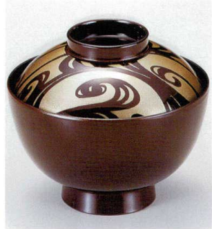
148-8 1-166-7 TA 新越前椀 溜抜き流水 S・H塗 ¥3,100 (11.1φ×9.7) 梱100