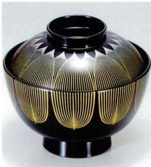
148-9 1-167-13 TA 新越前椀 笹 エース塗 ¥3,200 (11.1φ×9.7) 梱100