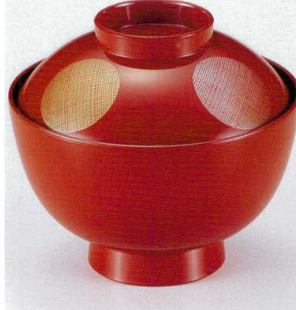
148-3 W-4-98 TA 新越前椀 朱日月 S・H塗 ¥2,600 (11.1φ×9.7) 梱100