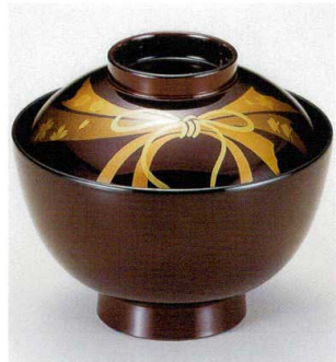
148-16 1-166-10 TA 新越前椀 溜のし S・H塗 ¥3,750 (11.1φ×9.7) 梱100