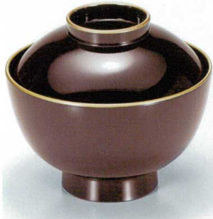
148-1 W-2-11 TA 新越前椀 マロン天金 ¥1,450 (11.1φ×9.7) 梱100