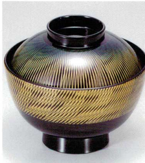
148-15 1-167-14 TA 新越前椀 萬松 エース塗 ¥3,550 (11.1φ×9.7) 梱100