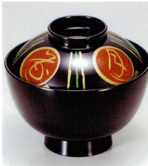
148-11 1-167-9 TA 新越前椀 風雪月花 エース塗 ¥3,650 (11.1φ×9.7) 梱100