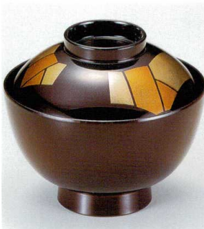
148-10 1-166-8 TA 新越前椀 溜結び S・H塗 ¥3,450 (11.1φ×9.7) 梱100