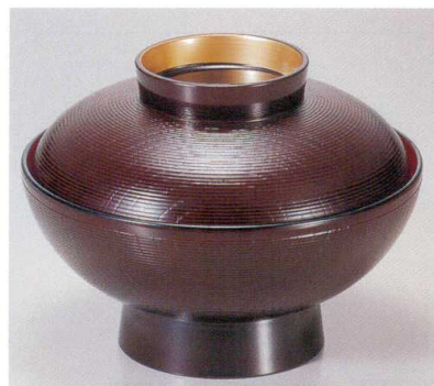
191-7 [A]保温煮物椀 溜千筋内朱つば金 1-193-7 ¥4,000 (17.5φ×13) 椀50