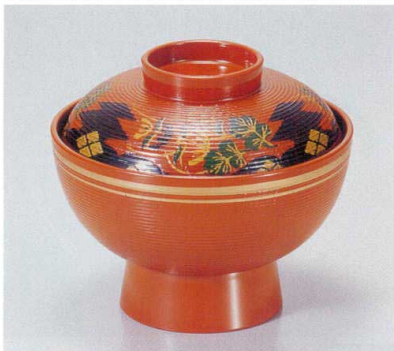
191-2 [A]保温千筋吸椀 朱正方寺金ライン 1-193-2 ¥2,750 (12φ×10.3) 椀100

◆洗淨機のご使用はさけて、手洗にてお願い致します。 乾燥機の使用は、絶対にさけて下さい。