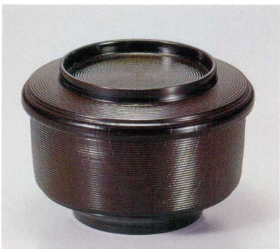
191-5 [A]保温飯器 溜千筋内朱 1-193-5 ¥2,750 (14.1φ×9.5) 椀100