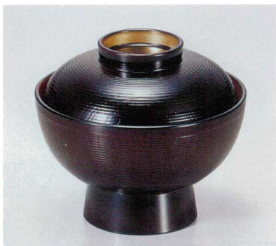
191-1 [A]保温千筋吸椀 溜内朱つば金 1-193-1 ¥2,450 (12φ×10.3) 椀100