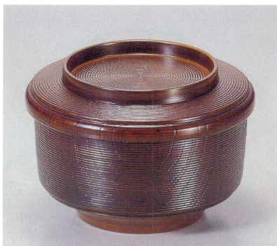
191-6 [A]保温飯器 栃千筋内朱 1-193-6 ¥2,850 (14.1φ×9.5) 椀100