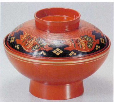
191-8 [A]保温煮物椀 朱千筋正方寺金ライン 1-193-8 ¥4,350 (17.5φ×13) 椀50