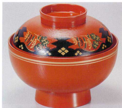
191-10 [A]保温井 朱千筋正方寺金ライン 1-193-10 ¥4,450 (17.6φ×14.7) 椀50