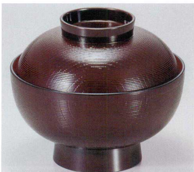
191-9 [A]保温井 溜千筋内朱 1-193-9 ¥4,200 (17.6φ×14.7) 椀50