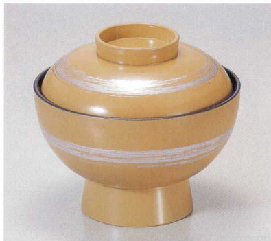
191-3 [A]保温吸椀 クリーム銀一筆内黒塗 1-193-3 ¥2,650 (12φ×10.5) 椀100