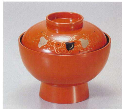
191-4 [A]保温吸椀 朱波千鳥内黒塗 1-193-4 ¥3,250 (12φ×10.5) 椀100