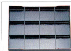
252-4 A 尺7寸松花堂用A仕切 1-248-7 ¥1,500