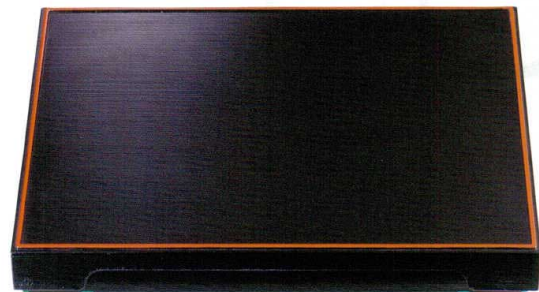
252-1 A 尺7寸長手御膳千筋松花堂 1-248-6 黒天朱内黒塗 (仕切別) (強化ABS) ¥8,250 (50.5×38.5×7) 梱10