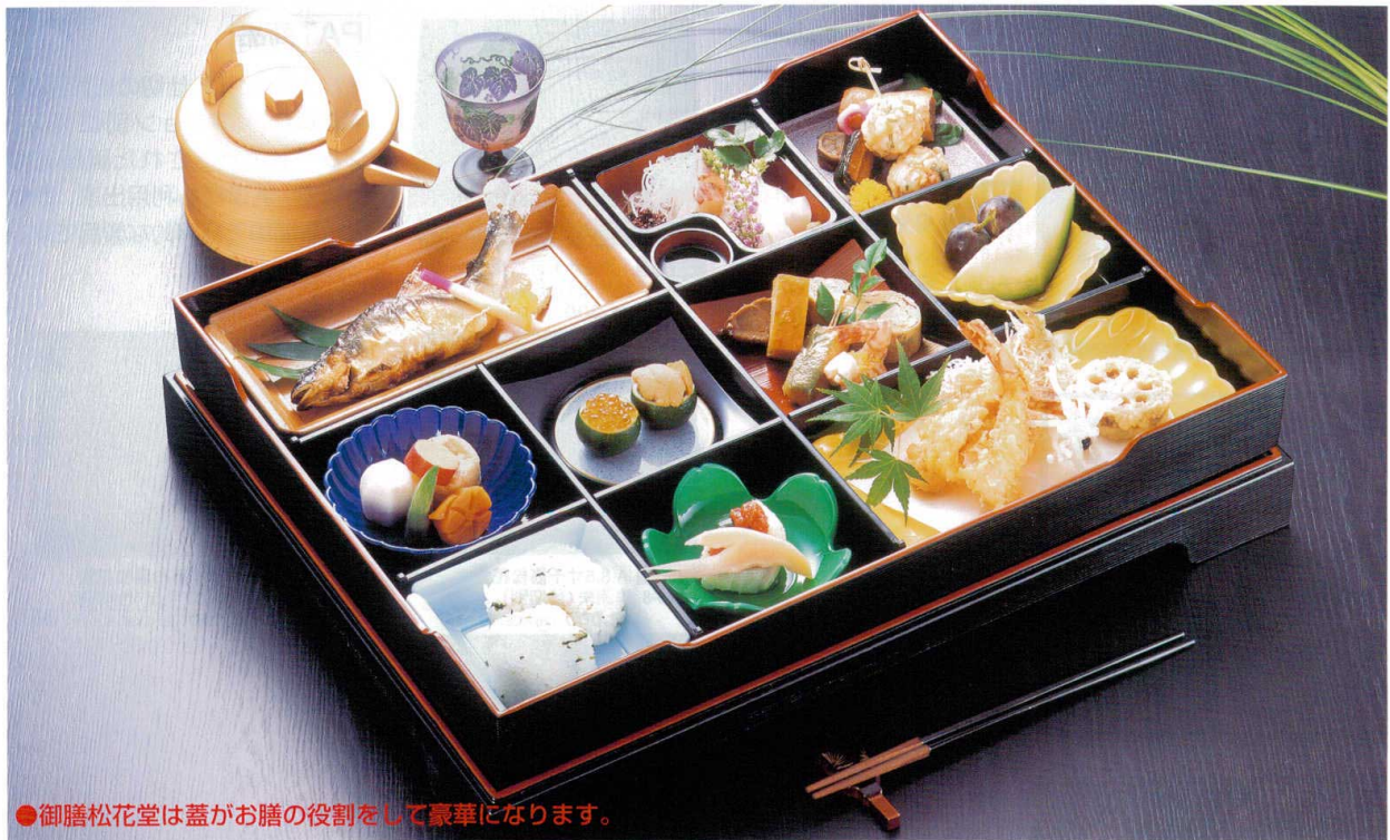
●御膳松花堂は蓋がお膳の役割をして豪華になります。