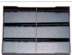
252-6 A 尺7寸松花堂用C仕切 1-248-9 ¥1,300