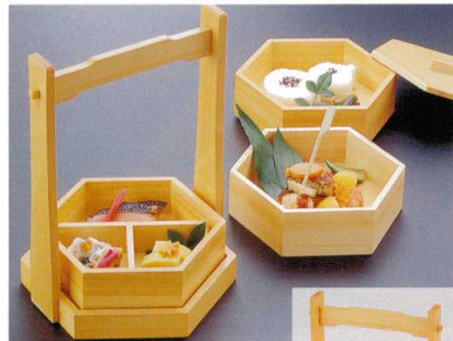
306-3 困六角手提げ弁当 1-316-3 ¥16,500 (20.1×20×26) 櫃10