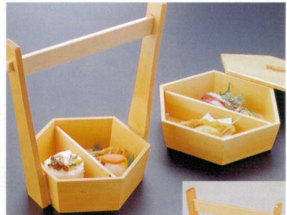
306-5 困手桶2段弁当 1-316-5 ¥17,100 (25.2×20.7×26) 櫃10