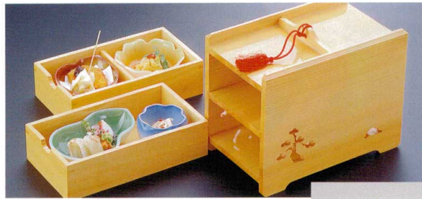
306-1 困2段引き出し弁当 1-316-1 ¥18,150 (21×12.5×18) 櫃20 A M この葉鉢 織部 ¥1,050 B M 花鉢 オレンジグリーン ¥950 C M ひさご鉢 グリーン ¥900 D 陶 桜型陶器 ブルー ¥1,100