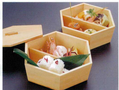
306-8 困六角弁当 1-316-8 ¥12,300 (20.7×17.8×13) 櫃20