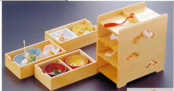
306-2 困3段引き出し弁当 1-316-2 ¥19,800 (21×12.5×20.5) 櫃20 A 陶 3寸角鉢 青磁 ¥1,100 B 陶 2.6寸菊型千代久 黄 ¥1,000 C M ひさご鉢 青磁 ¥900 D 陶 チューリップ珍味 ピンク ¥1,100 E A 2.6寸丸鉢 黒内朱 ¥450 F A 2.6寸丸鉢 朱内金 ¥800