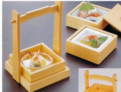
306-4 困手付正角弁当 1-316-4 ¥15,400 (20×16×26) 櫃10 A 陶 ゴース-珍仕切付鉢 ¥1,400 C 竹 丸かご ¥500