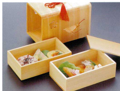
306-6 困弥生弁当 ウグイス 1-316-6 ¥15,000 (18×11.2×12.8) 櫃20