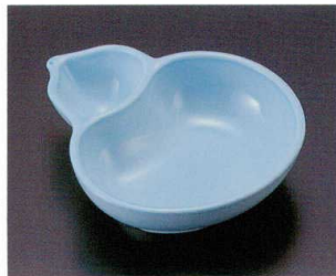
318-18 TA ひさごタレ付鉢 青磁 1-326-18 ¥900 (12.8×10.8×3.5) 棚200