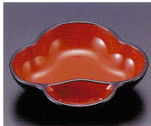
318-11 TA タレ付梅型鉢 黒内朱天黒 1-326-11 ¥850 (13.3×11.8×3.5) 棚200