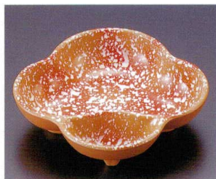
318-14 TA タレ付梅型鉢 赤志野 1-326-14 ¥1,050 (13.3×11.8×3.5) 棚200