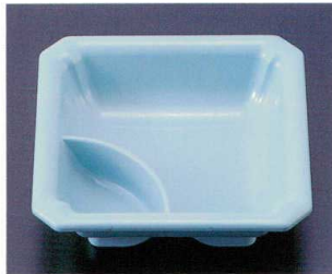
318-2 TA 隅切タレ付角鉢 青磁 1-326-2 ¥850 (11.3×11.3×3.5) 棚200