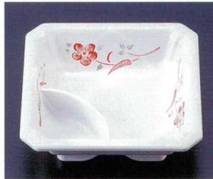
318-3 TA 隅切タレ付角鉢 赤絵 1-326-3 ¥1,150 (11.3×11.3×3.5) 棚200