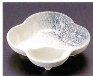
318-13 TA タレ付梅型鉢 志野 1-326-13 ¥1,050 (13.3×11.8×3.5) 棚200