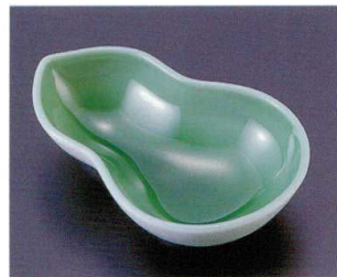
318-9 M ひさご鉢 グリーン 1-326-9 ¥900 (12.8×8.7×3.3) 棚200