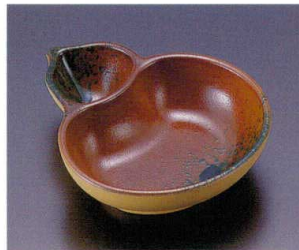
318-19 TA ひさごタレ付鉢 茶グリーン吹 1-326-19 ¥1,000 (12.8×10.8×3.5) 棚200