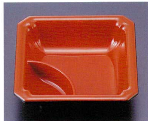
318-1 TA 隅切タレ付角鉢 黒内朱 1-326-1 ¥800 (11.3×11.3×3.5) 棚200