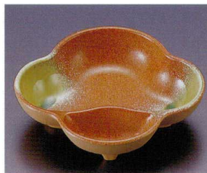
318-15 TA タレ付梅型鉢 若草織部 1-326-15 ¥1,150 (13.3×11.8×3.5) 棚200