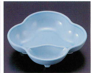
318-12 TA タレ付梅型鉢 青磁 1-326-12 ¥900 (13.3×11.8×3.5) 棚200