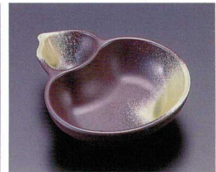
318-20 TA ひさごタレ付鉢 岩織部 1-326-20 ¥1,000 (12.8×10.8×3.5) 棚200