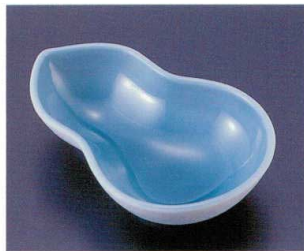
318-10 M ひさご鉢 青磁 1-326-10 ¥900 (12.8×8.7×3.3) 棚200