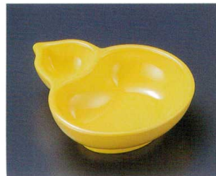
318-17 TA ひさごタレ付鉢 黄 C-2-56 ¥900 (12.8×10.8×3.5) 棚200