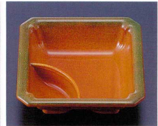
318-4 TA 隅切タレ付角鉢 柿釉 1-326-4 ¥1,150 (11.3×11.3×3.5) 棚200