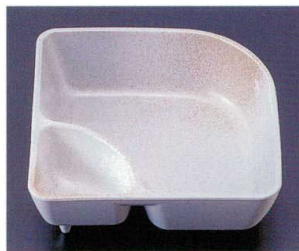
318-7 A 扇型タレ付鉢 金銀パール 1-326-7 ¥950 (11.1×11.1×3.7) 棚200