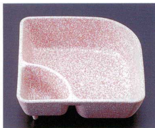
318-6 A 扇型タレ付鉢 桜志野 1-326-6 ¥950 (11.1×11.1×3.7) 棚200