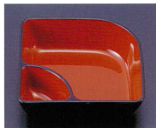
318-5 A 扇型タレ付鉢 黒内朱天黒 1-326-5 ¥800 (11.1×11.1×3.7) 棚200