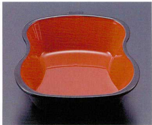
322-20 A ひさご鉢 朱天黒 1-328-20 ¥600 (11×11×3.8) 梱200