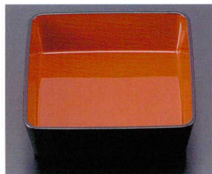
322-5 A 角鉢 朱天黒 1-328-5 ¥450 (11.5×11.5×3.5) 梱200