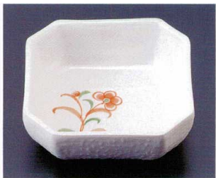
322-8 M 角小鉢 赤絵 1-328-8 ¥1,900 (11.3×11.3×3.8) 梱200