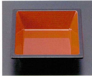
322-1 A D.X角鉢 朱天黒 1-328-1 ¥500 (11.3×11.3×3.5) 梱200