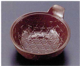
322-12 A 香水 春慶 1-328-12 ¥750 (12.5×11×5) 梱200