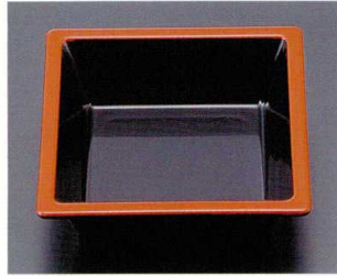
322-2 A D.X角鉢 黒天朱 1-328-2 ¥500 (11.3×11.3×3.5) 梱200