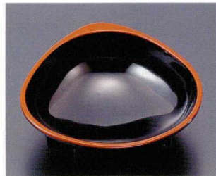
322-18 A はまぐり鉢 黒天朱 1-328-18 ¥700 (11.2×10.7×3.5) 梱200