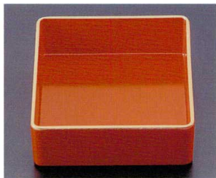
322-7 M 角鉢 朱天金 1-328-7 ¥800 (11.2×11.2×4.4) 梱200