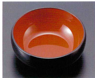
322-9 A 4寸丸鉢 朱天黒(段付) 1-328-9 ¥500 (11.5φ×4.2) 梱200