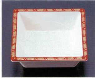
322-3 A D.X角鉢 アイボリー天朱アジロ 1-328-3 ¥650 (11.3×11.3×3.5) 梱200