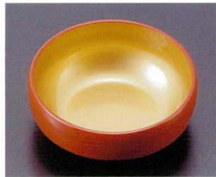
322-10 A 4寸丸鉢 朱内金(段付) 1-328-10 ¥900 (11.5φ×4.2) 梱200