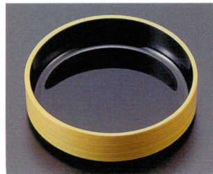
322-17 M 丸鉢 白木内黒 1-328-17 ¥1,000 (11.2φ×2.7) 梱200