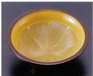
322-16 A すり鉢 1-328-16 ¥550 (12φ×4.3) 梱200