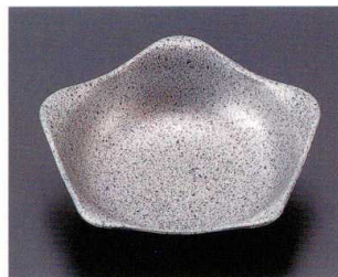
322-14 A 五角鉢 銀黒石目 1-328-14 ¥1,000 (11×11×3.4) 梱200