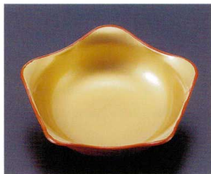
322-15 A 五角鉢 朱内金 1-328-15 ¥1,100 (11×11×3.4) 梱200