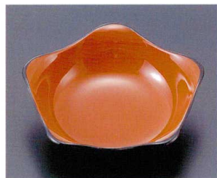
322-13 A 五角鉢 朱 1-328-13 ¥550 (11×11×3.4) 梱200