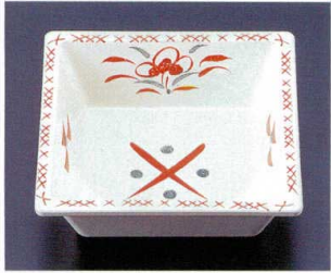
322-4 A D.X角鉢 赤絵 1-328-4 ¥950 (11.3×11.3×3.5) 梱200