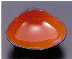
322-19 A はまぐり鉢 朱天黒 1-328-19 ¥700 (11.2×10.7×3.5) 梱200