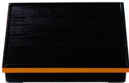
358-1 A 尺1寸長手へギ目松花堂 1-240-5 黒瀾朱(仕切別) ¥2,450 (31.3×26×6.8) 梱20