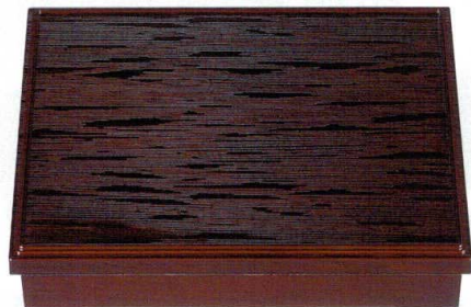
358-2 A 尺1寸長手へギ目松花堂 1-241-5 溜(仕切別) ¥2,850 (31.3×26×6.8) 梱20