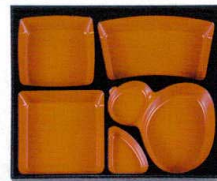
358-5 1-366-5 A 尺1寸長手御膳松花堂用 ひさご仕切 朱天黒 ¥1,350 (29.1×23.6×3.9) 梱50