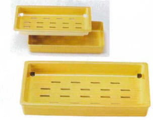
526-1 [P.P] ネット受け(小) 水受け付 グリーン O-2-28 ¥900 (20.2×11.1×3.2) 棚120 526-2 [P.P] ネット受け(大) 水受け付 グリーン O-2-29 ¥950 (22.9×12.9×3.2) 棚100