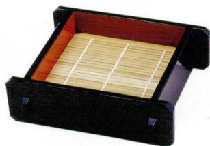
550-1 ニュー井桁 一口セイロ (底板付) 黒内朱 S-7-37 A 本体 ¥1,300 (14.8×16.7×5.4) 梱60 S-7-37A 竹竹ス (11.8×11.8cm) 1枚 ¥400 (11.8×11.8)