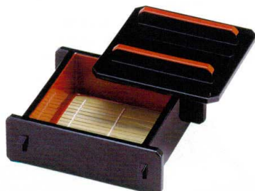
550-8 蓋付ミニセイロ 黒内朱天朱 (底板付) 1-535-9 A 本体 ¥1,250 (13.5×12×5) 梱60 1-535-9A A 蓋 ¥850 (11.1×11.1×2.3) 梱100 1-535-9B 竹竹ス (9×9cm) 1枚 ¥400 (9×9)