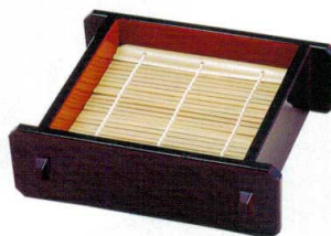
550-3 ニュー井桁 一口セイロ (底板付) 溜内朱 S-7-38 A 本体 ¥1,600 (14.8×16.7×5.4) 梱60 S-7-37A 竹竹ス (11.8×11.8cm) 1枚 ¥400 (11.8×11.8)