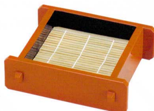
550-6 D.Xツノセイロ 朱天朱 1-534-1 A 本体 ¥1,900 (17×15×5.3) 梱60 1-534-3A 竹竹ス (11.5×11.5cm) 1枚 ¥380 (11.5×11.5)