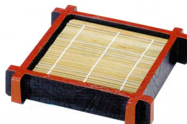
550-10 (大) D.X井桁ザル 地木目黒天朱 1-534-4 A 本体 ¥2,050 (20×20×4) 梱60 1-534-4A 竹竹ス (14.8×14.8cm) 1枚 ¥430 (14.8×14.8)