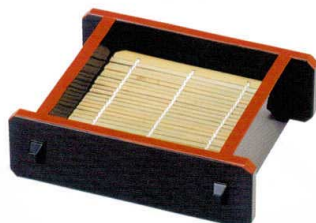
550-5 D.Xツノセイロ 黒天朱 1-534-2 A 本体 ¥1,850 (17×15×5.3) 梱60 1-534-3A 竹竹ス (11.5×11.5cm) 1枚 ¥380 (11.5×11.5)