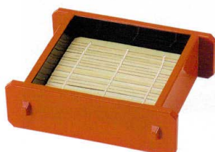
550-2 ニュー井桁 一口セイロ (底板付) 朱天朱 S-8-4 A 本体 ¥1,300 (14.8×16.7×5.4) 梱60 S-7-37A 竹竹ス (11.8×11.8cm) 1枚 ¥400 (11.8×11.8)