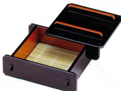
550-9 蓋付 (大) セイロ 黒内朱天朱 (底板付) 1-535-10 A 本体 ¥1,850 (16.4×14.5×5.3) 梱60 1-535-10A A 蓋 ¥1,250 (13×13×2.5) 梱100 1-534-3A 竹竹ス (11.5×11.5cm) 1枚 ¥380 (11.5×11.5)