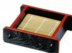
550-7 (小) 井桁ザル 地木目黒天朱 1-534-3 A 本体 ¥1,900 (16.7×14.8×5.3) 梱60 1-534-3A 竹竹ス (11.5×11.5cm) 1枚 ¥380 (11.5×11.5)