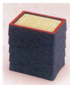
新D.X盛そばは、スペースをとりません。