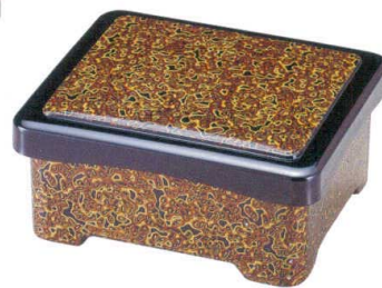
607-5 A 象足井重 金虫喰内朱塗 1-573-3 ¥2,850 (16.8×14.3×7.6) 梱60