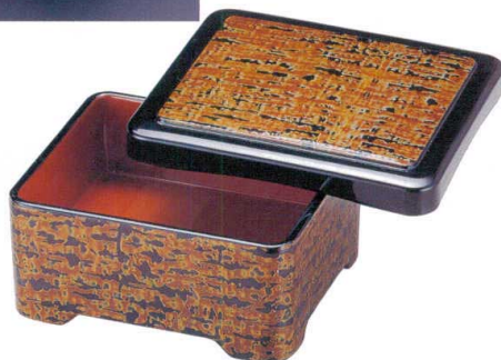
607-4 A 象足井重 銀格子内朱塗 1-573-2 ¥2,850 (16.8×14.3×7.6) 梱60