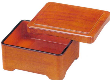
607-6 A 象足井重 紫植内朱塗 エース塗 1-573-4 ¥3,000 (16.8×14.3×7.6) 梱60