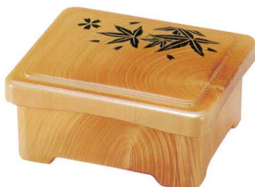
607-3 A 象足井重 花梨春秋内朱塗 1-573-1 ¥2,700 (16.8×14.3×7.6) 梱60