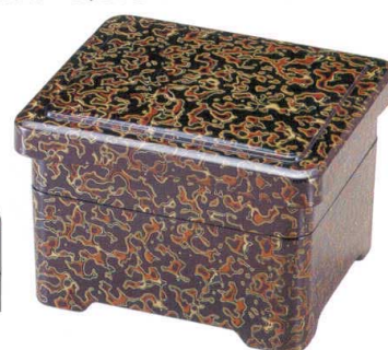
607-11 A 象足井重 堆朱内朱塗 1-573-8 1段 ¥2,900 (16.8×14.3×7.6) 梱60 2段 ¥4,350 (16.8×14.3×11.3) 梱30 1-573-8A 中段のみ ¥1,450 (16.8×14.3×3.7) 梱80