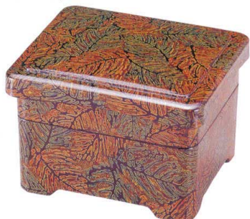
607-9 A 象足井重 木ノ葉内朱塗 1-573-6 1段 ¥2,650 (16.8×14.3×7.6) 梱60 2段 ¥3,950 (16.8×14.3×11.3) 梱30 1-573-6A 中段のみ ¥1,300 (16.8×14.3×3.7) 梱80