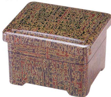
607-10 A 象足井重 垣根格子内朱塗 1-573-7 1段 ¥2,850 (16.8×14.3×7.6) 梱60 2段 ¥4,200 (16.8×14.3×11.3) 梱30 1-573-7A 中段のみ ¥1,350 (16.8×14.3×3.7) 梱80