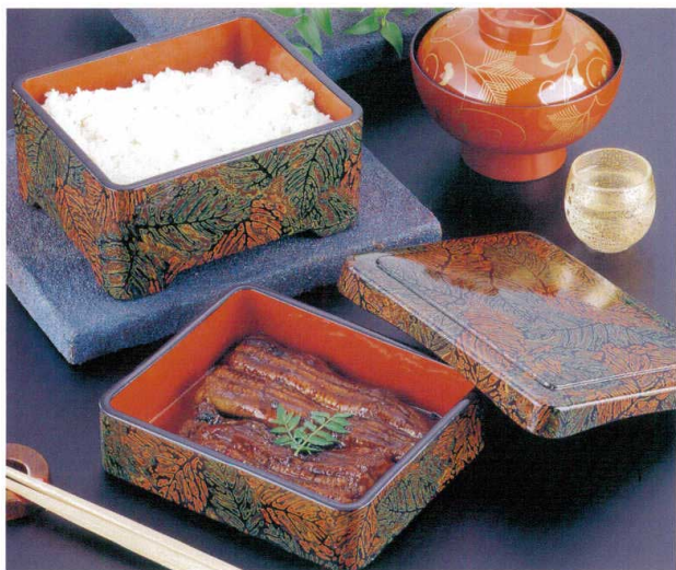
607-1 U-1-21 A 象足井重 梨地竹内朱 ¥1,650 (16.8×14.3×7.6) 梱60