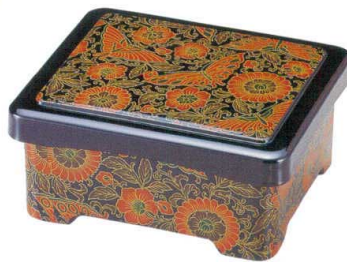
607-8 A 象足井重 古代蝶内朱塗 1-573-5 ¥3,000 (16.8×14.3×7.6) 梱60