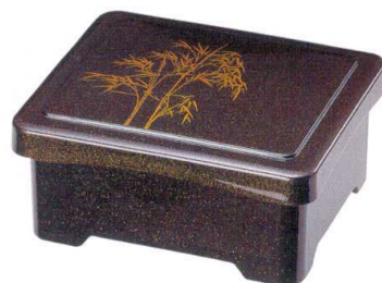
607-2 U-1-22 A 象足井重 梨地新扇面内朱 ¥2,000 (16.8×14.3×7.6) 梱60