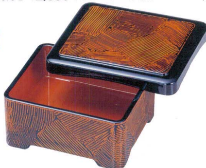
607-7 A 象足井重 あやとり内朱塗 エース塗 U-1-1 ¥3,150 (16.8×14.3×7.6) 梱60