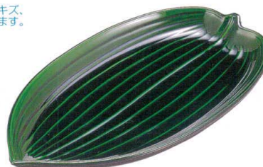
687-5 1-655-22 [A] ニュー笹の葉皿 緑別甲 ¥900 (21.8×12.2×1) 梱100