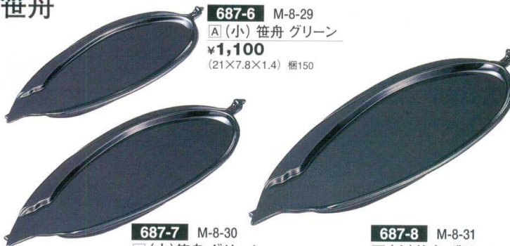
687-6 M-8-29 [A] (小) 笹舟 グリーン ¥1,100 (21×7.8×1.4) 梱150