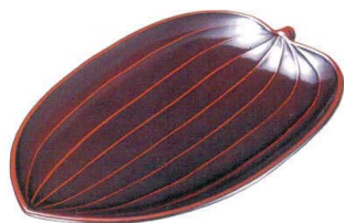
687-3 M-8-27 [A] 新笹皿 栃 ¥950 (15.8×10.3×1.3) 梱200