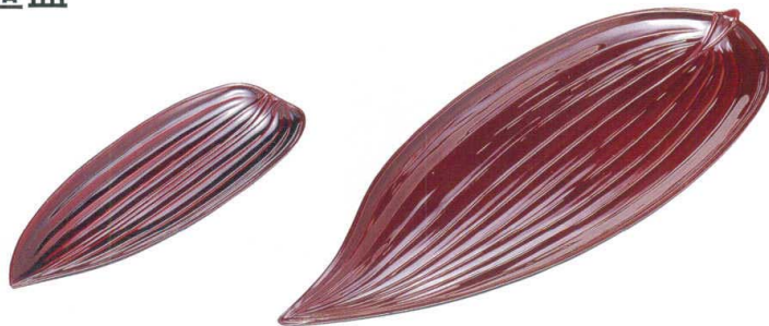
687-1 [A] (小) 笹皿 溜 1-655-4 ¥750 (19.5×7×1.2) 梱200