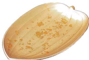
687-4 M-8-28 [A] 新笹皿 色紙金箔 S・H塗 ¥1,750 (15.8×10.3×1.3) 梱200