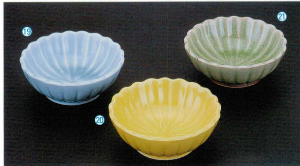
734-19 1-338-20 陶 3寸菊型千代久 青磁 ¥1,000 (9φ×3.2) 梱100 734-20 1-338-22 陶 3寸菊型千代久 黄 ¥1,000 (9φ×3.2) 梱100 734-21 1-338-21 陶 3寸菊型千代久 ヒワ ¥1,000 (9φ×3.2) 梱100