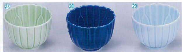
734-27 M-4-28 陶 深型菊鉢 グリーン ¥480 (8.4φ×6) 梱144 734-28 M-4-29 陶 深型菊鉢 瑠璃 ¥480 (8.4φ×6) 梱144 734-29 M-4-30 陶 深型菊鉢 青磁 ¥480 (8.4φ×6) 梱144