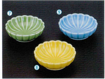
734-7 1-655-10B 陶 菊豆皿 ヒワグリーン ¥630 (5.8φ×1.8) 梱200 734-8 1-655-10C 陶 菊豆皿 黄 ¥630 (5.8φ×1.8) 梱200 734-9 1-655-10A 陶 菊豆皿 トルコ ¥630 (5.8φ×1.8) 梱200