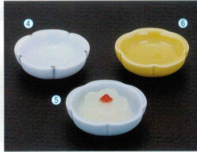
734-4 1-666-1F 陶 梅豆皿 古染立筋 ¥680 (5.8φ×1.8) 梱200 734-5 1-666-1D 陶 梅豆皿 トルコ ¥680 (5.8φ×1.8) 梱200 734-6 1-666-1E 陶 梅豆皿 黄 ¥680 (5.8φ×1.8) 梱200