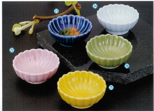
734-22 1-337-16 陶 2.6寸菊型千代久 ピンク ¥850 (7.8φ×3.3) 梱100 734-23 1-337-15 陶 2.6寸菊型千代久 瑠璃 ¥1,000 (7.8φ×3.3) 梱100 734-24 1-337-14 陶 2.6寸菊型千代久 青磁 ¥1,000 (7.8φ×3.3) 梱100 734-25 1-337-12 陶 2.6寸菊型千代久 黄 ¥1,000 (7.8φ×3.3) 梱100 734-26 1-337-13 陶 2.6寸菊型千代久 グリーン ¥850 (7.8φ×3.3) 梱100