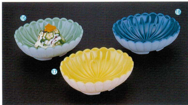
734-16 1-338-15 M 長菊鉢 グリーン ¥850 (9.2×7.9×3) 梱200 734-17 1-338-13 M 長菊鉢 黄 ¥850 (9.2×7.9×3) 梱200 734-18 1-338-14 M 長菊鉢 瑠璃 ¥850 (9.2×7.9×3) 梱200