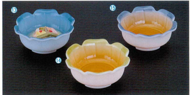
734-13 1-338-9 M 花鉢 青磁 ¥750 (9.1×9.1×3.7) 梱200 734-14 1-338-10 M 花鉢 オレンジグリーン ¥950 (9.1×9.1×3.7) 梱200 734-15 1-338-11 M 花鉢 オレンジ紫 ¥950 (9.1×9.1×3.7) 梱200