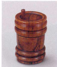
907-3 H-9-59 木|タル型七味入れ ¥900 (5.1φ×8.5) 梱100