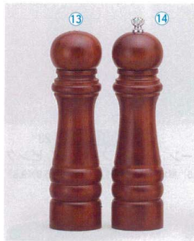
907-13 SPS-7 塩入れ 1-778-18 ¥3,000 (17.5) 梱100 907-14 SPS-7 こしょう挽 1-778-19 ¥5,250 (17.5) 梱100