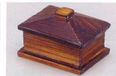
907-24 1-514-19 木家型楊子入れ ¥1,150 (9.4×6.9×6) 梱200