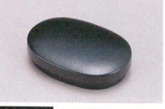
907-26 1-777-5 M|小判楊子入れ グリーン乾漆 ¥850 (9.5×6.5×2.4) 梱200