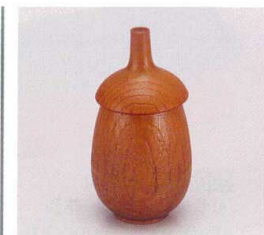
907-15 1-560-10 A|なす型珍味入れ すりうるし ¥1,200 (5φ×10) 梱200