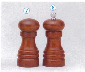
907-7 SPS-3.5 塩入れ 1-778-24 ¥2,050 (9.5) 梱100 907-8 SPS-3.5 こしょう挽 1-778-25 ¥4,000 (9.5) 梱100