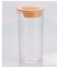
907-4 1-804-4 AC|Y-110W ウォーターピッチャー ¥2,400 (8.4φ×18) 梱20