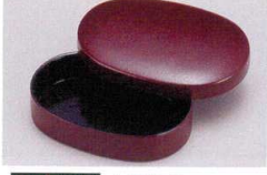
907-27 1-777-6 M|小判楊子入れ 茶乾漆 ¥850 (9.5×6.5×2.4) 梱200