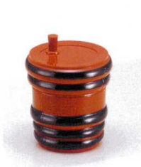
907-1 1-560-9 AC|タル型七味入れ 朱に帯黒 ¥595 (5.8φ×7) 梱200