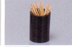
907-30 K-105-16-7 M|WK-11 ようじ立て (黒) ¥300 (5.8φ×4.2) 梱200

*907-4~907-14・907-16~18・907-30の商品は、掛率が異なりますのでご注意ください。