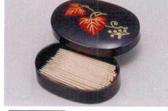
907-28 1-514-17 M|小判楊子入れ ツタ ¥950 (9.5×6.5×2.4) 梱200