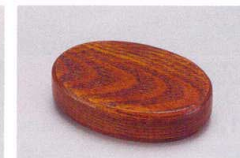
907-25 1-514-20 木小判楊子入れ スリ漆 ¥1,500 (8.7×5.8×2.9) 梱200