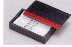
907-29 1-777-10 木楊子入れ 黒/朱 ¥2,400 (10×7.4×3) 梱100