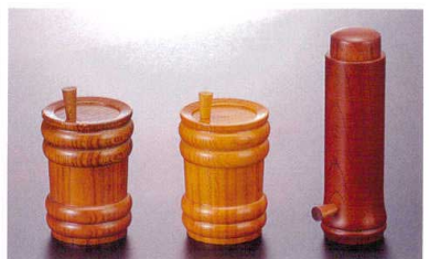
907-16 木桶型薬味入 茶 1-778-12 ¥1,550 (4.5φ×9) 梱100 907-17 木桶型薬味入 黄 1-778-13 ¥1,550 (4.5φ×9) 梱100 907-18 木筒型薬味入 1-778-14 ¥2,300 (4φ×12.2) 梱100