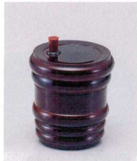
907-2 S-8-80 AC|タル型七味入れ 溜 ¥680 (5.8φ×7) 梱200