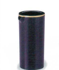
907-5 H-3-52 AC|ウォーターピッチャー 黒淵金 (底塗) ¥2,500 (8.4φ×18) 梱20