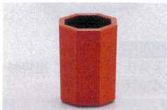
907-22 1-514-15 A|八角妻楊子入れ ワインパール天朱 ¥520 (4×4×5.6) 梱200