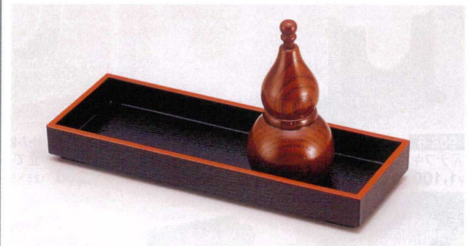
907-19 1-104-1 A|新カスター盆 黒木目天朱 ¥950 (23.2×8.6×2.7) 梱100 907-20 1-777-17 困ひょうたん型 七味入れ ¥1,000 (6φ×11.2) 梱200