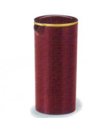
907-6 H-3-8 AC|ウォーターピッチャー マロン淵金 (底塗) ¥2,500 (8.4φ×18) 梱20