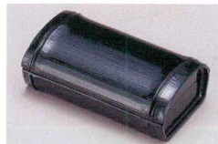
907-23 1-514-18 M|竹型楊子入れ グリーン ¥1,000 (9.3×5.3×3.1) 梱200