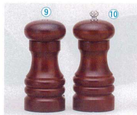
907-9 SPS-4 塩入れ 1-778-22 ¥2,600 (11.5) 梱100 907-10 SPS-4 こしょう挽 1-778-23 ¥4,550 (11.5) 梱100