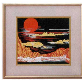
933-7 1-820-16 パネル 日の出 ¥25,000 (41.1×38)