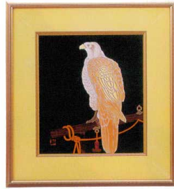
933-3 1-820-7 パネル 鷹(エボック) ¥25,000 (38×41.1)