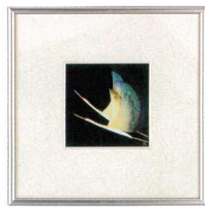
933-17 1-821-6 銀額(小) 鶴 ¥34,500 (30.5×30.5)