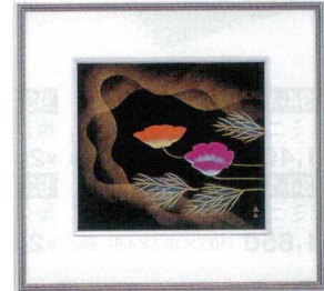
933-15 1-821-9 色紙銀額 アネモネ ¥60,000 (44.5×41.8)