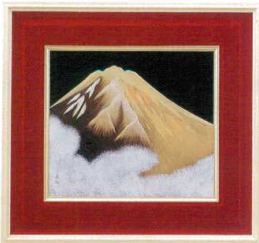
933-9 1-821-1 パネル色紙 金富士 ¥40,000 (41.1×38.1)