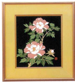
933-2 1-820-4 パネル 椿 ¥25,000 (38×41.1)