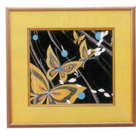
933-8 1-820-17 パネル 蝶 ¥25,000 (41.1×38)