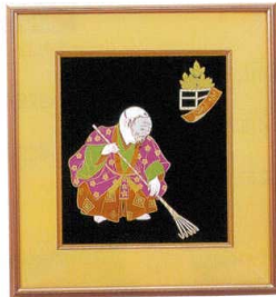
933-6 1-820-15 パネル 高砂 ¥25,000 (38×41.1)