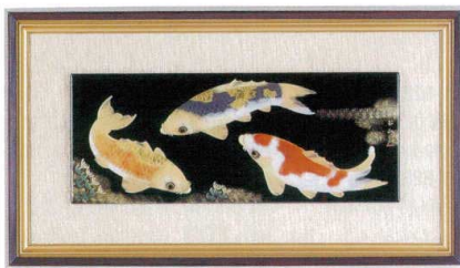
933-13 1-821-15 パネル長手 鯉 ¥60,000 (64×36)