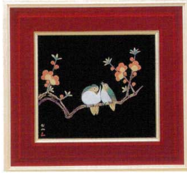
933-10 1-821-2 パネル色紙 目白 ¥28,500 (41.1×38.1)