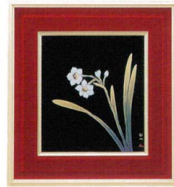
933-11 1-821-4 パネル色紙 水仙 ¥28,500 (38.1×41.1)