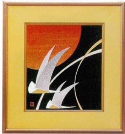
933-1 1-820-1 パネル 折鶴 ¥25,000 (38×41.1)