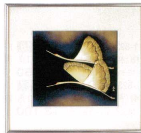
933-14 1-821-8 色紙銀額 鶴 ¥60,000 (43.8×40.8)