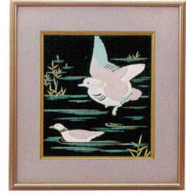
933-4 1-820-11 パネル おしどり ¥25,000 (38×41.1)