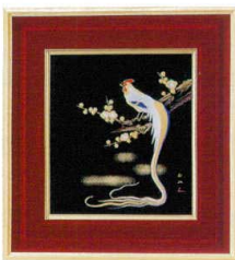
933-16 H-9-81 パネル色紙白枠 尾長鳥 ¥28,500 (41.2×38.3)