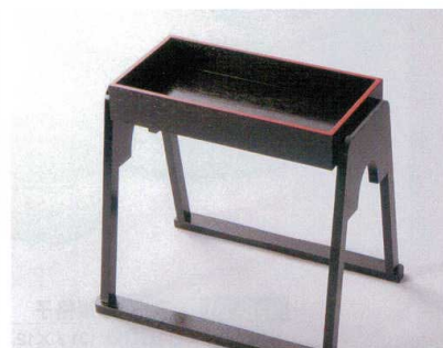
935-20 木脇台 黒天朱 H-19-64 ¥22,000 (49×35×45) 梱5