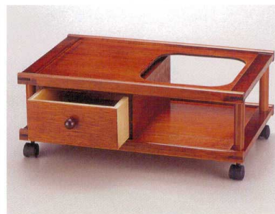
935-17 木ホームワゴン ケヤキ 1-826-8 ¥25,000 (50.5×32.5×20.5) 梱8