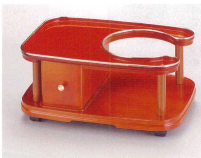
935-16 M引出付ワゴン 木目 1-826-5 ¥13,000 (45×33×20) 梱10