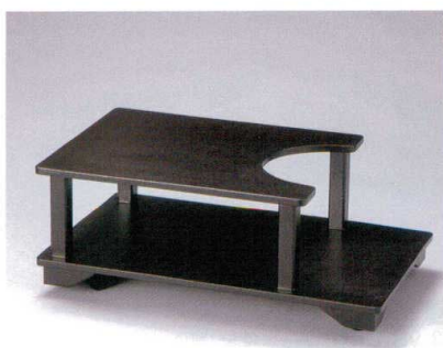
935-18 木ポットワゴン うるみ石目 H-19-62 ¥37,000 (60×37×23) 梱2