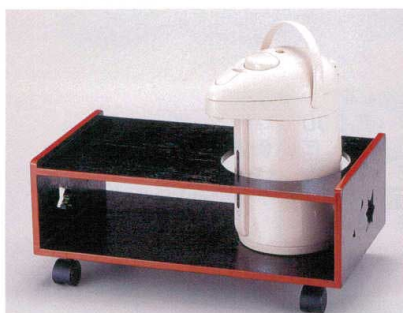
935-15 木お座敷ワゴン 黒木目天朱(車付) 1-826-3 ¥22,000 (53.4×30×22.5) 梱2