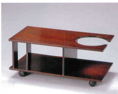
935-19 木ポットワゴン けやき H-19-63 ¥41,000 (65×35×28) 梱2