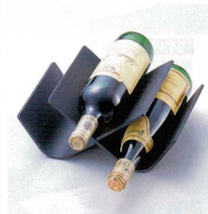
944-12 H-10-35 A ワインラック 黒 ¥2,900 (27×18×12) 櫃50