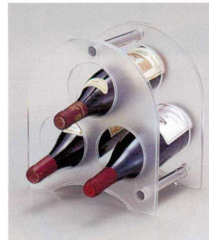
944-16 1-827-11 AC ワインラック 透明 ¥4,750 (25.5×16.5×28) 櫃8