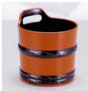
944-7 1-827-9 M 桶ワインクーラー 朱帯黒 ¥3,300 (16φ×17.5) 櫃24