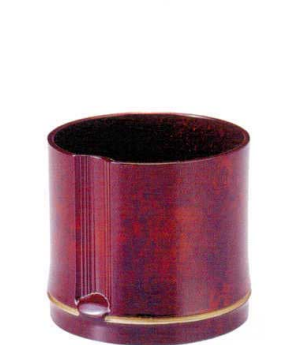
944-13 H-3-25 M 竹型ボトルクーラー 八雲帯金 ¥4,300 (16.7φ×15) 櫃10