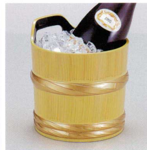
944-8 1-827-10 M 桶ワインクーラー 白木帯金 ¥3,350 (16φ×17.5) 櫃24