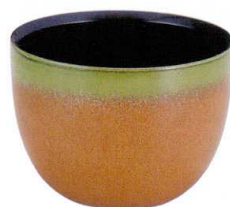
944-3 1-827-3 Mパーティークーラー 若草織部 ¥5,000 (21φ×15.2) 櫃10