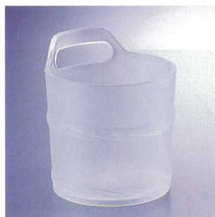
944-5 H-10-33 AC 桶冷酒用クーラー フロスト塗 ¥3,300 (12.5φ×14.5H) 櫃20