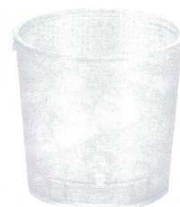
944-4 1-804-3 AC Y-100W アイスペール(スノ子付) ¥2,400 (13.2φ×12.5) 櫃30