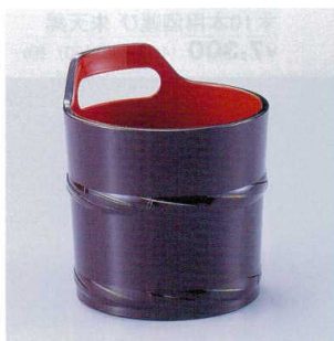
944-6 H-10-34 A 桶冷酒用クーラー 溜内朱 ¥3,600 (12.5φ×14.5H) 櫃20