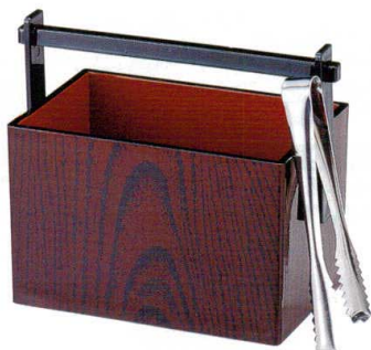
944-2 AアイスBOX木目 1-827-2 (目皿・アイストング付) ¥4,100 (18.7×10.8×15.2) 櫃20