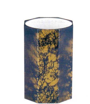
944-15 1-827-7 M 八角ワインクーラー 青パール八雲 ¥4,650 (11.9×11.9×18.6) 櫃40