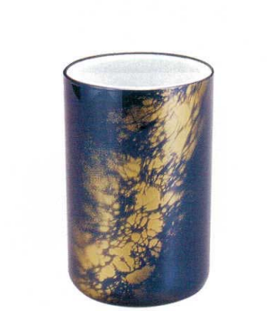
944-14 1-827-6 M 丸ワインクーラー 青パール八雲 ¥3,700 (11.8φ×18.3) 櫃40