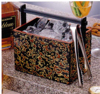
944-1 AアイスBOXツイシュ 1-827-1 (目皿・アイストング付) ¥4,100 (18.7×10.8×15.2) 櫃20