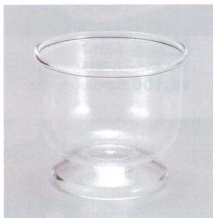
944-10 1-827-14 AC 足付ワインクーラー 透明 ¥3,200 (18φ×16) 櫃10