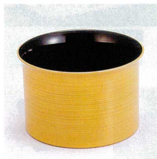
944-9 H-3-73 M 冷酒用クーラー 白木天クリーム ¥3,000 (18.5φ×12) 櫃20