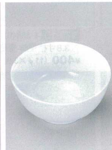
974-7 H-8-20 陶スープ碗白 11φ ¥320 (11.4φ×5.4)