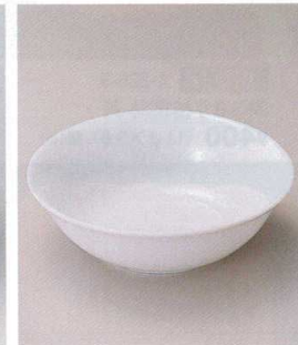
974-8 H-8-21 陶フルーツ皿白 15φ ¥480 (15φ×4.7)