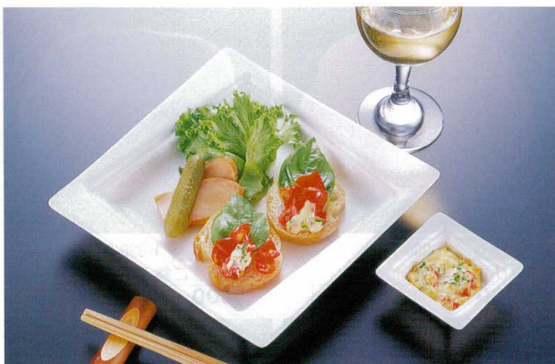
974-2 H-8-28 陶くりぬき皿白 19cm ¥1,080 (18.5×18.5×3.2)