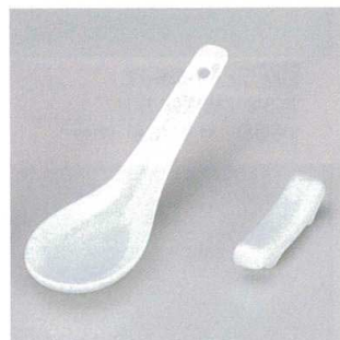
974-3 H-8-15 陶レンゲ白 ¥120 (4.3×13.3)