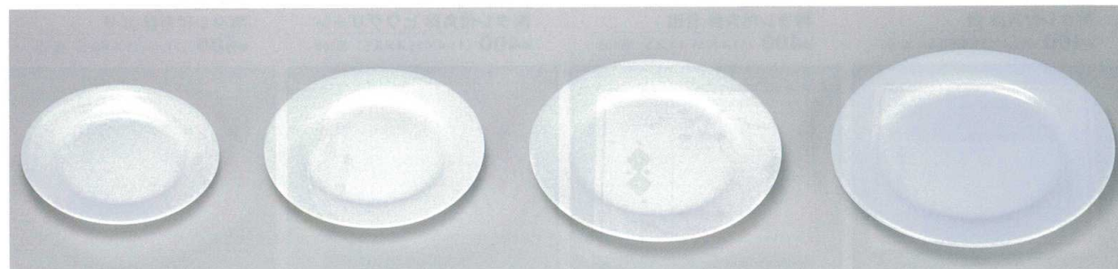
974-9 H-8-16 陶丸皿白 17.5φ ¥330 (17.6φ×1.9)