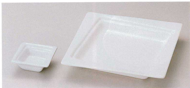
974-1 H-8-25 陶くりぬき皿白 7cm ¥360 (7×7×2.9)