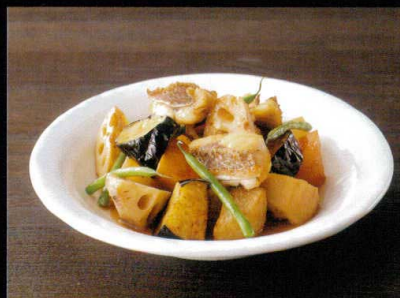
筑前煮 9"スープ(白マット)

作り感あふれる、土ののような表面の質感に あたたかなぬくもりを感じます。白と黒のカラーが、 クラフト感と対照的にモダンを演出します。