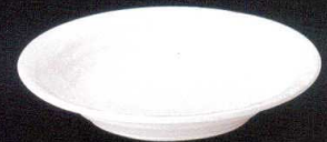
40301227 9"スープ(白マット) ¥1,000 D22.8×H4