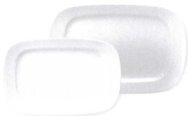
51100244 10"プラター ¥2,550 L26×S17.2×H2.4 (SILKY BONE)