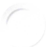
51100214 6½"パン ¥630 D16.8×H1.7