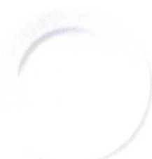
51100219 7½"ケーキ ¥780 D19.4×H2