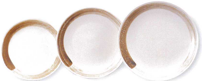
51300010 8.0皿 ¥1,900 D24.1×H3.6