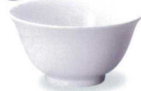
21700314 8"反深口丼(スーパーチャイナ) ¥2,800 D19.9×H10.4