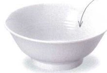
22400280 7.0反計量丼 ¥1,200 D21.3×H8.6