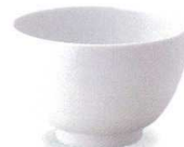
22400258 5.0丸深井 ¥1,450 D15.6×H10.1