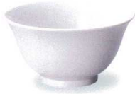
22400270 6.5反深口丼 ¥2,000 D20.3×H10.7