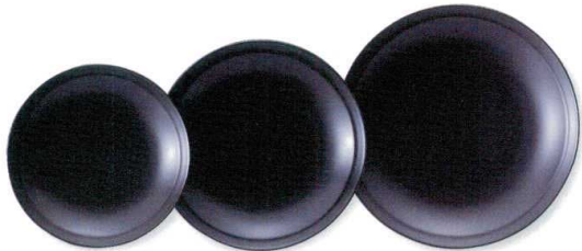
11000006 6.0皿 ¥850 D18.5×H2.8