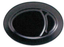
NEW 11000115 9"仕切小判 ¥1,500 L23.3×S17×H2.7