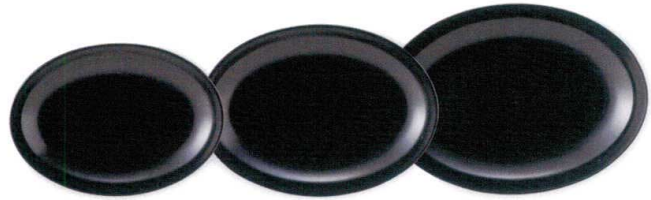
NEW 11000195 8"プラター ¥1,150 L21.1×S15.1×H2.4