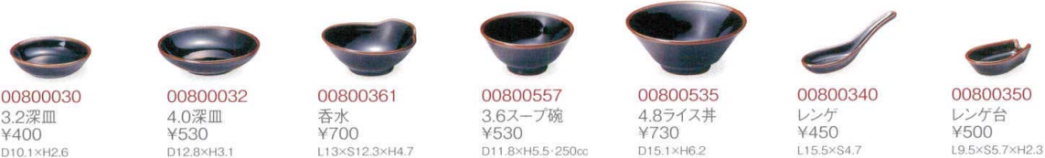
00800030 3.2深皿 ¥400 D10.1×H2.6 00800032 4.0深皿 ¥530 D12.8×H3.1 00800361 香水 ¥700 L13×S12.3×H4.7 00800557 3.6スープ碗 ¥530 D11.8×H5.5・250cc 00800535 4.8ライス井 ¥730 D15.1×H6.2 00800340 レンゲ ¥450 L15.5×S4.7 00800350 レンゲ台 ¥500 L9.5×S5.7×H2.3