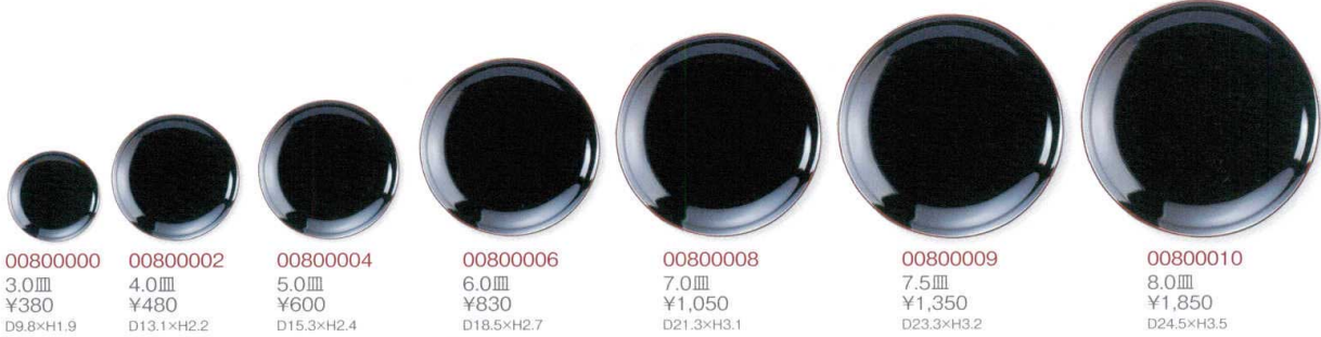
00800000 3.0皿 ¥380 D9.8×H1.9 00800002 4.0皿 ¥480 D13.1×H2.2 00800004 5.0皿 ¥600 D15.3×H2.4 00800006 6.0皿 ¥830 D18.5×H2.7 00800008 7.0皿 ¥1,050 D21.3×H3.1 00800009 7.5皿 ¥1,350 D23.3×H3.2 00800010 8.0皿 ¥1,850 D24.5×H3.5