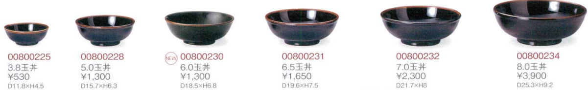
00800225 3.8玉井 ¥530 D11.8×H4.5 00800228 5.0玉井 ¥1,300 D15.7×H6.3 NEW 00800230 6.0玉井 ¥1,300 D18.5×H6.8 00800231 6.5玉井 ¥1,650 D19.6×H7.5 00800232 7.0玉井 ¥2,300 D21.7×H8 00800234 8.0玉井 ¥3,900 D25.3×H9.2