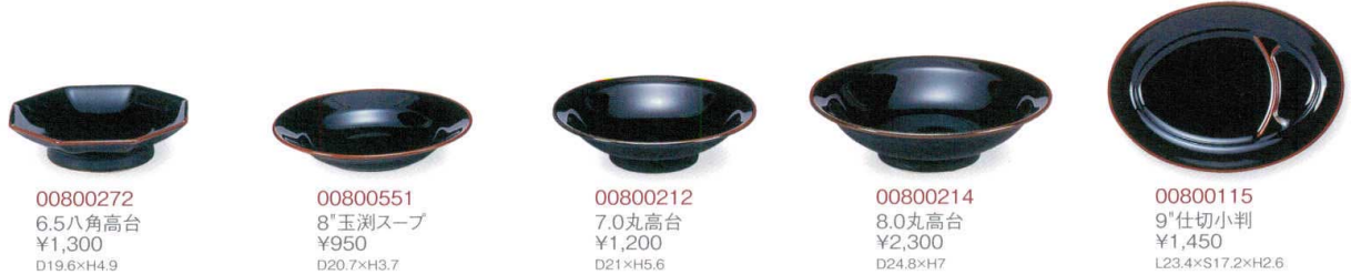
00800272 6.5八角高台 ¥1,300 D19.6×H4.9 00800551 8"玉淵スープ ¥950 D20.7×H3.7 00800212 7.0丸高台 ¥1,200 D21×H5.6 00800214 8.0丸高台 ¥2,300 D24.8×H7 00800115 9"仕切小判 ¥1,450 L23.4×S17.2×H2.6