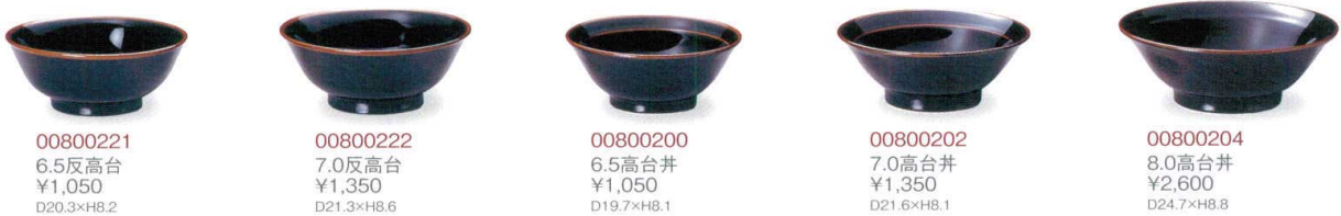
00800221 6.5反高台 ¥1,050 D20.3×H8.2 00800222 7.0反高台 ¥1,350 D21.3×H8.6 00800200 6.5高台井 ¥1,050 D19.7×H8.1 00800202 7.0高台井 ¥1,350 D21.6×H8.1 00800204 8.0高台井 ¥2,600 D24.7×H8.8