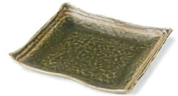
22-5-73 織部ライン角大皿 ¥4,725 (12入) 瀬戸焼 (本体価格¥4,500)