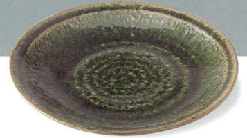
22-3-11 織部大皿(手造) ¥5,670 (20入) 美濃焼 (本体価格¥5,400)