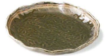
22-4-73 織部ライン波型大皿 ¥5,250 (10入) 瀬戸焼 (本体価格¥5,000)