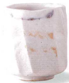
4-6-24 美濃焼 志野流線湯呑 ¥13,650 (30入) 品:湯呑×1 / φ8×9.5cm (本体価格 ¥13,000) 箱:11×11×13.5cm 木