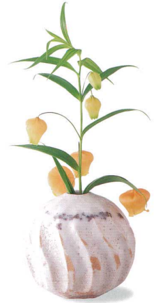
4-5-24 美濃焼 志野流線小壺 ¥7,875 (24入) 品:小壺×1 / φ10×9cm (本体価格 ¥7,500) 箱:12×12×13cm 木