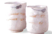
4-7-24 美濃焼 志野流線組湯呑 ¥7,875 (20入) 品:湯呑大×1 / φ6.5×8.3cm、(本体価格 ¥7,500) 湯呑小×1 / φ6×7.3cm 箱:17.5×11.5×10cm 木