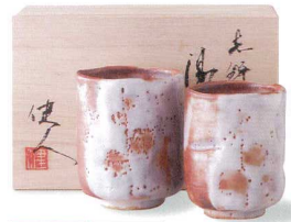
4-8-24 美濃焼 赤志野梅紋組湯呑 ¥7,875 (20入) 品:湯呑大×1 / φ6.5×8.3cm、(本体価格 ¥7,500) 湯呑小×1 / φ6×7.3cm 箱:17.5×11.5×10cm 木