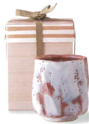
4-1-24 美濃焼 赤志野梅紋湯呑 ¥13,650 (30入) 品:湯呑×1 / φ8×9.5cm (本体価格 ¥13,000) 箱:11×11×13.5cm 木

昭和五十六年 土岐市市民職能研修 入賞 昭和五十八年 第一回 新日本陶芸展 入選「志野流線壺」 昭和四十二年 二二一特別賞「香田磁器製作家展」入選 昭和四十九年 岐阜県立百富芸術祭 入賞 昭和五十二年 横濱市ワタリマシヤの 作品展 昭和五十九年 第三十回 日本伝統工芸展「粉引茶分壺」入選 昭和六十年 第三十四回 東海伝統工芸展「粉引茶分壺」入選 昭和六十年 第三十二回 日本伝統工芸展「志野湯呑」入選 昭和六十二年 第十七回 東海伝統工芸展「志野壺」入選 昭和六十二年 第十九回 東海伝統工芸展「志野干面壺」入選 平成五年 伝統工芸士認定