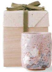
4-3-24 美濃焼 ピンク志野湯呑 ¥13,650 (30入) 品:湯呑×1 / φ8×9.5cm (本体価格 ¥13,000) 箱:11×11×13.5cm 木