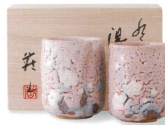
4-4-24 美濃焼 ピンク志野組湯呑 ¥7,875 (20入) 品:湯呑(大)×1 / φ6.5×8.5cm、(本体価格 ¥7,500) 湯呑(小)×1 / φ6.2×8cm 箱:17.5×11.5×10cm 木