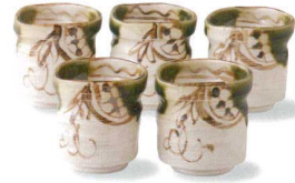
6-4-77 瀬戸 赤津焼 塩草窯 織部まどつる小湯呑揃 ¥5,250 (12入) 高: 小湯呑×5 / φ8.3×6.5cm 箱: 25×16.9×9cm 貼箱 (本体価格 ¥5,000)