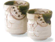
6-5-77 瀬戸 赤津焼 塩草窯 織部まどつる粗湯呑 ¥3,150 (18入) 高: 湯呑 (大)×1 / φ7.3×8.4cm 湯呑 (小)×1 / φ6.8×7.5cm 箱: 16×10.1×8.2cm 貼箱 (本体価格 ¥3,000)