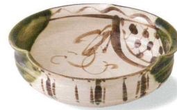
6-6-77 瀬戸 赤津焼 塩草窯 織部まどつる盛鉢 ¥3,990 (16入) 高: 盛鉢×1 / φ18×5.5cm 箱: 20.6×20.6×6.7cm 貼箱 (本体価格 ¥3,800)