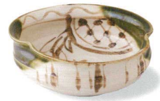
6-7-77 瀬戸 赤津焼 塩草窯 織部まどつる平鉢 ¥2,940 (20入) 高: 平鉢×1 / φ14.8×5.4cm 箱: 16.3×16.3×7.4cm 貼箱 (本体価格 ¥2,800)