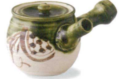
6-9-77 瀬戸 赤津焼 塩草窯 織部まどつる急須 ¥3,990 (18入) 高: 急須×1 / 340cc 箱: 16.8×16.8×11.6cm 貼箱 (本体価格 ¥3,800)