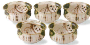
6-8-77 瀬戸 赤津焼 塩草窯 織部まどつる小付揃 ¥4,725 (16入) 高: 小付×5 / φ8.8×4.5cm 箱: 23.8×10×10cm 貼箱 (本体価格 ¥4,500)