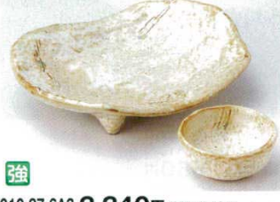
強 010-27-6A3 2,240円 2361010027 白唐津(岩石)三つ足変形刺身皿 (17×13.5×4H) 010-28-6A3 840円 2361010028 白唐津(岩石)丸千代口 (7φ×3H)