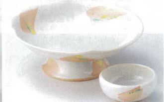
010-17-6F3 2,300円 2065011039 紅三彩高台向付 (15.3φ×5.8H) 010-18-6F3 1,150円 1965012041 紅三彩丸千代口 (6.3φ×2.7H)