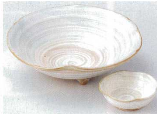
010-06-6A3 2,370円 2361010006 粉引刷毛目6.0三つ足浅鉢 (18.5φ×6H) 010-07-6A3 1,600円 2361010007 粉引刷毛目5.0三つ足浅鉢 (15φ×4.5H) 010-08-6A3 690円 2361010008 粉引刷毛目輪花形千代口 (8φ×3H)