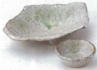
010-21-6A3 2,260円 2161013003 かいらぎ変形向付 (20×14.5×5H) 010-22-6A3 880円 2161013004 かいらぎ丸千代口 (8φ×3H)