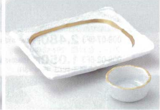
010-25-7F3 2,250円 2075154031 石割金彩焼物皿 (18.3×15.3×2.7H) 010-26-7F3 900円 2075154032 石割金彩丸千代口 (6.7φ×3H)