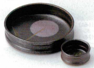
010-19-6E3 2,300円 2264011013 備前風草紋刺身鉢(手造り) (17φ×3.5H) 010-20-6E3 880円 2264011014 備前風草紋千代口(手造り) (7φ×3H)