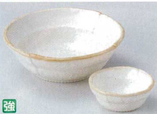
強 010-01-6A3 2,370円 2161013037 口鏝(石焼)5.0向 (14φ×5H) 010-02-6A3 850円 2161013038 口鏝(石焼)丸千代口 (7φ×3H)

刺身向付小鉢珍味 絵皿和皿大皿鉢鉢 酒器箸置き 丼・茶碗 急須・茶器 和陶オーブン 耐熱・萬古焼 洋食器・碗皿 中華食器 カラス・金属 茶道具 雑器 木・竹製品 神仏具