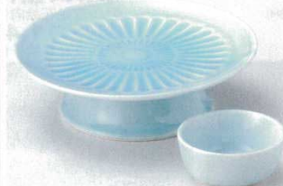
010-15-7C3 2,300円 1973013029 青白磁菊形高台皿 (15.5φ×4.5H) 010-16-7C3 750円 1973013030 青白磁丸千代口 (6.5φ×3H)