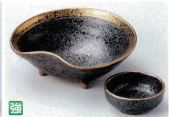
強 010-09-6A3 2,310円 2161012032 黒ちらし刷金巻5.0片押浅鉢 (15×13×5.5H) 010-10-6A3 730円 2161012033 黒ちらし口金三つ足丸千代口 (7φ×2.5H)