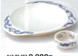
010-29-6F3 2,200円 2265011023 粉引色唐草変形皿 (22.5×18×2.7H) 010-30-6F3 850円 2265011024 粉引色唐草千代口 (6.5φ×3H)