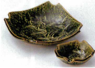
010-37-1K3 2,200円 2217012036 織部芦彫5.0刺身皿 (16×16×3.5H) 010-38-1K3 1,200円 2217012037 織部芦彫2.8角千代口 (8.6×8.6×3.5H)