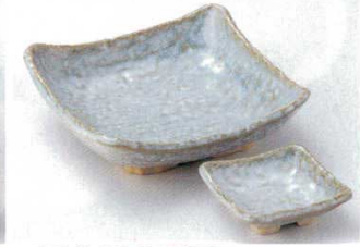
010-41-4A3 2,200円 1941026020 露6.0正角鉢 (16.2×16.2×5H) 010-42-4A3 1,250円 1941018009 露5.0正角鉢 (14×14×4.8H) 010-43-4A3 420円 1941018010 露正角小皿 (8.2×8.2×2.5H)