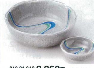
010-31-6A3 2,260円 2361010031 ねずみ流水5.5丸ボール (16.5φ×5H) 010-32-6A3 920円 2361010032 ねずみ流水丸千代口 (8φ×3H)