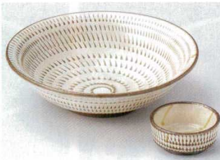
010-03-6A3 2,420円 2261527002 手彫り(飛びカンナ)6.0鉢 (17.5φ×4.5H) 010-04-6A3 1,820円 2261527003 手彫り(飛びカンナ)5.0鉢 (14.5φ×4H) 010-05-6A3 760円 2261527006 手彫り(飛びカンナ)切立千代口 (6φ×2.5H)