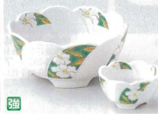
強 010-23-7F3 2,250円 1975015009 彩花刺身鉢 (14φ×6.2H) 010-24-7F3 1,050円 1975015010 彩花千代口 (7φ×3.9H)