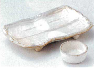
010-35-6F3 2,250円 1965013023 粉引まな板皿 (22.5×14×3.5H) 010-36-6F3 730円 1965013024 粉引千代久 (7φ×3.3H)