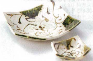
010-11-4B3 2,300円 2242010021 織部ペルシャ刺身 (16×16×4.3H) 010-12-4B3 1,300円 2242010022 織部ペルシャ千代口 (8.5×8.5×3.5H)