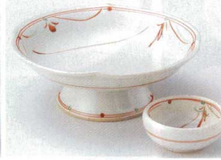
010-39-7E3 2,200円 2274011007 赤絵輪花高台向付 (15φ×5H) 010-40-7E3 1,180円 2274011008 赤絵輪花丸千代口 (6.4φ×2.5H)