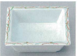
110-20-1B3 1,200円 1912088018 ススキ角鉢 (11.4×3.6H)