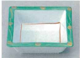
110-11-1B3 1,200円 1912088022 青武蔵野角鉢 (11.4×11.4×3.5H)