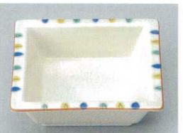
110-21-1B3 1,180円 1912088028 色とり貫入角鉢 (11.5×11.5×3.7H)