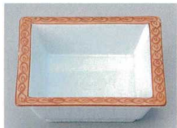
110-06-2B3 1,250円 2222112025 測つ角鉢 (11.4×11.4×3.5H)