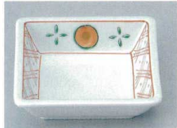
110-01-6A3 1,270円 2161118012 赤間取4.0角形井 (11.5×11.5×3.5H)

刺身用・小鉢・珍味 椀・お茶碗 湯呑・茶碗蓋 丼・茶碗 急須・茶器 和陶・オーブン 耐熱・古式焼 洋食器・碗皿 中華食器 カブ・入・金属 茶道具 雑器 木・竹製品 神・仏具