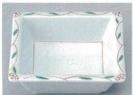
110-27-1B3 1,150円 1912088030 錦菊角鉢 (11.4×11.4×3.5H)