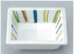
110-04-1K3 1,250円 1917088026 色十草角鉢 (11.4×11.4×3.5H)