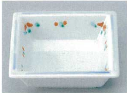
110-02-1K3 1,250円 2017101014 手描小花角鉢 (11.5×11.5×3.5H)