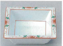
110-05-2B3 1,250円 2222112024 赤絵花つなぎ角鉢 (11.4×11.4×3.5H)