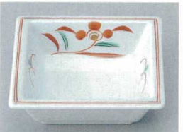
110-15-1B3 1,200円 2012101009 古代花角鉢 (11.4×3.6H)