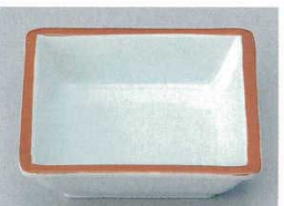
110-30-6A3 1,100円 2161119008 測赤巻4.0角形井 (11.5×11.5×3.5H)