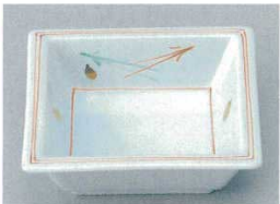
110-18-1B3 1,200円 2012101006 松葉角鉢 (11.4×3.6H)