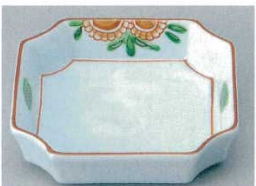
110-28-1B3 1,150円 1912094022 入角赤絵なす (11×11×2.8H)