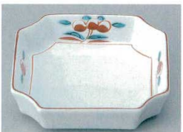
110-29-1B3 1,150円 1912094021 入角赤絵なすな (11×11×2.8H)