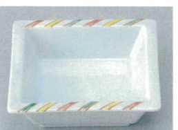
110-26-1B3 1,150円 1912088031 彩十草角鉢 (11.4×11.4×3.5H)