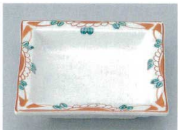
110-08-6B3 1,230円 1962093002 赤測菊松花堂 (10.8×2.5H)