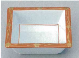
110-12-1B3 1,200円 1912088021 赤武蔵野角鉢 (11.4×11.4×3.5H)