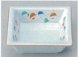
110-13-1B3 1,200円 2212112021 花唐草角鉢 (11.4×11.4×3.6H)