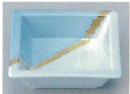
110-16-1B3 1,200円 2012101005 金彩角鉢 (11.4×3.6H) 110-17-1B3 1,040円 2012109013 金彩ミニ角鉢 (9.2×3H)