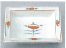
110-09-6B3 1,230円 1962093003 玉菊松花堂 (10.8×2.5H)