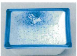
110-24-1B3 1,150円 1912088024 吹墨月ウサギ角鉢 (11.4×11.4×3.5H)