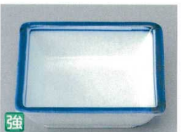
110-10-2A3 1,220円 2321110010 測呉須正角鉢 (11×11×3.2H)