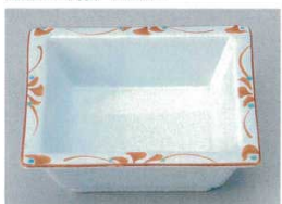
110-22-1B3 1,180円 1912088019 赤絵小花角鉢 (11.4×11.4×3.6H)