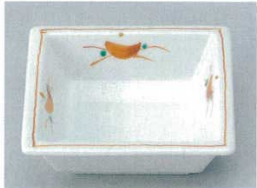
110-03-1K3 1,250円 2017101016 手描赤絵花角鉢 (11.5×11.5×3.5H)