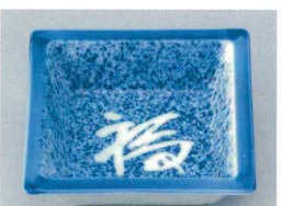
110-25-1B3 1,150円 1912088027 吹墨福角鉢 (11.4×3.6H)