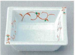
110-14-2B3 1,200円 2322110014 唐草角鉢 (11.4×11.4×3.5H) 120入