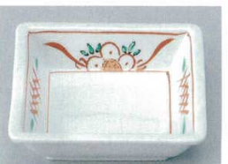
110-31-6A3 1,080円 2161118031 赤万暦4.0角形井 (11.5×11.5×3.5H)