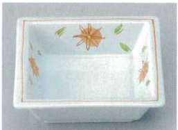
110-19-1B3 1,200円 2212112020 カスリ紋角鉢 (11.4×11.4×3.6H)