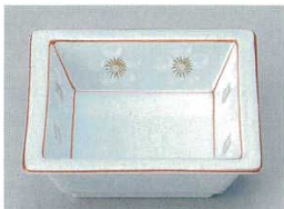
110-07-2B3 1,250円 2322110007 白梅角鉢 (11.4×11.4×3.5H) 120入