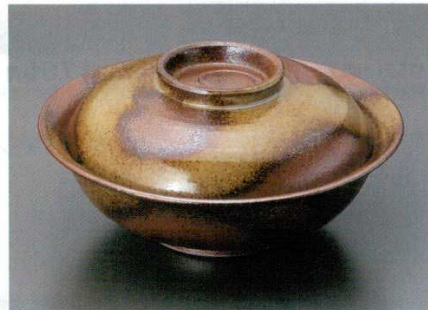
116-09-1K3 4,700円 1917098014 南蛮蓋向 (16.8φ×8H)