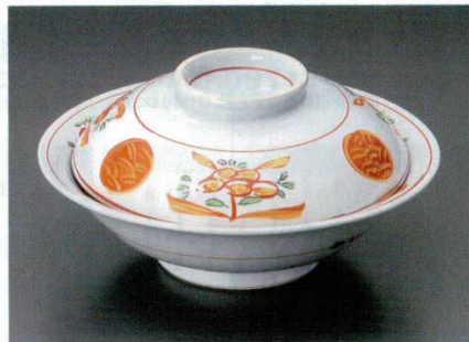
116-07-6F3 8,800円 1965096003 乾山赤絵8.0骨むし (25φ×12.5H) 116-08-6F3 5,300円 1965096004 乾山赤絵7.0骨むし (21φ×10.5H)