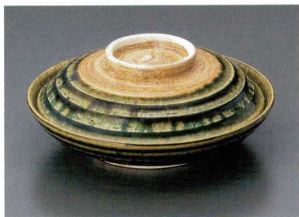
116-01-6F3 6,500円 1965097002 織部骨むし (21φ×8H)