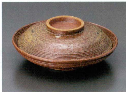
116-02-6F3 6,500円 1965097004 焼締骨むし (20.5φ×8H)