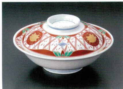
116-05-6F3 8,900円 2165127014 華陽紋8.0骨むし (25φ×12H) 116-06-6F3 5,500円 2165127015 華陽紋7.0骨むし (21.5φ×10.5H)