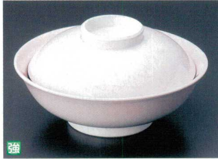
119-01-2A3 2,980円 2321119001 吹墨平蓋向 (16.8φ×9H)