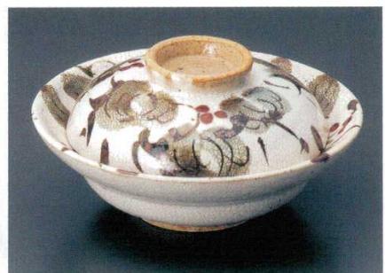
119-12-8F3 2,200円 2385119012 山帰来(茶)段付平蓋向 (14.6φ×7H)