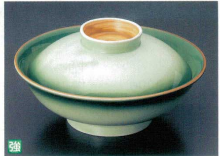
119-05-7F3 2,800円 2175129010 むさしの京型蓋向 (14.3φ×7.8H)