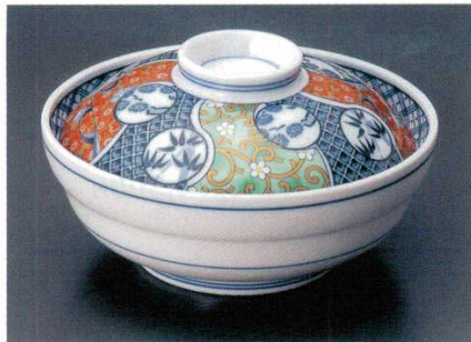
119-04-7F3 2,800円 2075113011 祥瑞吉野京形蓋向 (14.8φ×8H)