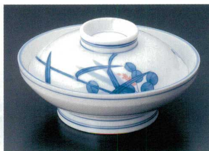
119-11-6F3 2,250円 2365119011 紅萩平蓋向 (16φ×8.7H)