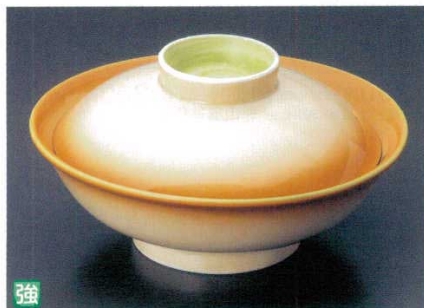
119-06-2A3 2,760円 2021112007 緑彩平蓋向 (16.8φ×9H)