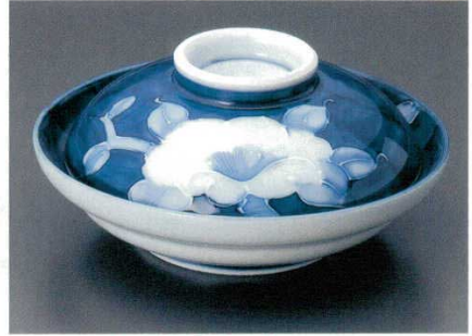
119-03-2A3 2,880円 1921099011 白盛牡丹平蓋向 (17φ×8.5H)