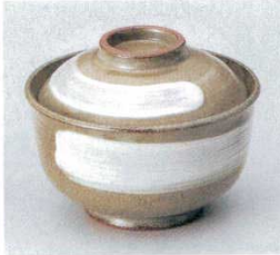
123-02-6E3 2,450円 2034118009 粉引刷毛目円菓子碗 (12.2φ×9.5H)