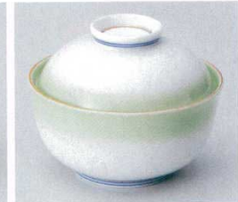
123-26-6F3 1,750円 2265126021 三色吹煮物碗(小) (10φ×8H) 中国