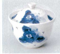
123-04-7E3 2,400円 2374123004 呉須ダミ椿蓋物 (11.2φ×10.5H)