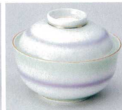
123-24-6F3 2,200円 2265126019 三色吹煮物碗(大) (13φ×11H) 中国