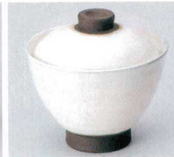
123-15-8F3 1,600円 2085121020 白釉蓋付碗 (10.5φ×10.5H)