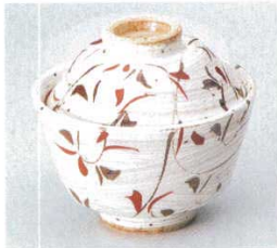
123-01-8F3 2,450円 2185137010 赤絵サビ唐草蓋付碗 (10.3φ×9.2H)