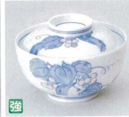
123-09-3H3 2,050円 1936107013 宴煮物碗 (11.8φ×9H)