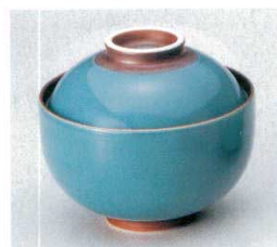
123-17-7E3 1,350円 1974107017 ヒスイ円菓子碗 (11φ×10H)