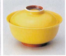
123-10-7E3 1,850円 2374123010 黄釉反型円菓子碗 (13φ×8.8H)