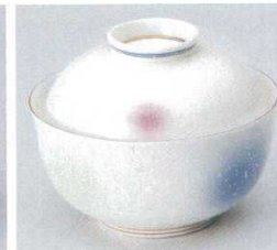
123-25-6F3 1,980円 2265126020 三色吹煮物碗(中) (11.5φ×9.5H) 中国