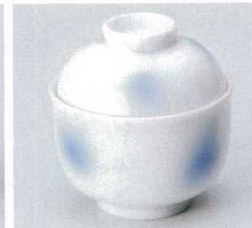
123-20-8F3 800円 2385123020 吹墨円菓子碗 (9.5φ×10H)