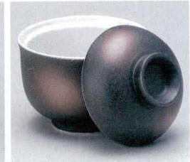
123-21-8F3 720円 2285127015 備前内白円菓子碗 (9.5φ×10H)