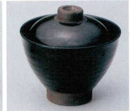
123-16-8F3 1,550円 2085121019 黒釉蓋付碗 (10.5φ×10.5H)