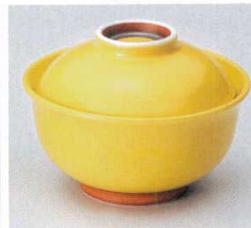
123-14-7E3 1,600円 2374123014 黄釉反型円菓子碗(小) (10.9φ×7.9H)