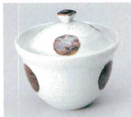
123-06-7E3 2,300円 2374123006 さび水玉蓋物 (11.2φ×10.5H)