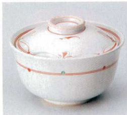
123-07-7E3 2,300円 2274127001 赤絵輪花菓子碗 (12φ×8.6H)