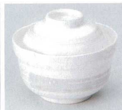
123-23-8F3 720円 2385123023 粉引刷毛目蓋物 (10φ×8H)