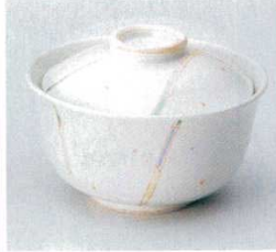
123-03-7E3 2,400円 2374123003 彩竹菓子碗 (12.3φ×8.6H)