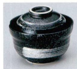
123-22-8F3 720円 2385123022 黒水晶刷毛目蓋物 (10φ×8H)