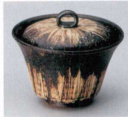
123-08-8F3 2,200円 2185137016 焼締白刷毛蓋付碗 (11.2φ×9.8H)