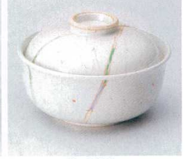
123-05-7E3 2,400円 2374123005 彩竹煮物碗 (13.2φ×8.7H)