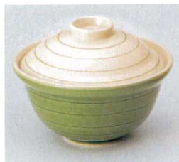
123-12-2A3 1,850円 2321123012 グリーン渦福碗(蓋付) (11φ×8H)