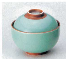
123-18-7E3 1,260円 1974107020 もえぎ円菓子碗(小) (10φ×9H)