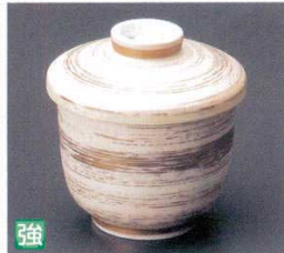
125-07-1B3 2,700円 1912110019 金刷毛目京形むし碗 (7.6φ×8.5H)