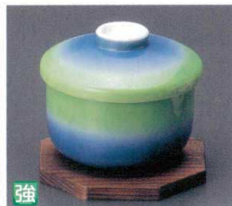
125-18-6F3 3,000円 1965109013 二色吹夏むし碗 (9.8φ×8.5H)