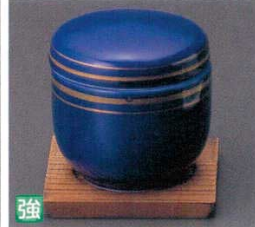
125-32-6F3 2,200円 1965111001 青釉金線夏目むし碗 (7.8φ×8.5H)