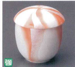
125-15-7F3 2,250円 2075125009 オレンジ銀彩ネジリむし碗(大) (7.5φ×8H)