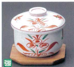
125-16-6F3 3,000円 1965109011 赤絵花大むし碗 (9.8φ×8.5H)