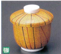
125-06-1B3 2,770円 2312125006 金彩十草京型蒸し碗 (7.6φ×8.8H)