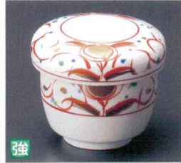
125-05-2A3 2,770円 1921109017 赤絵華紋むし (7.5φ×7.7H)