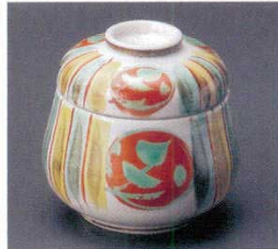
125-08-2F3 2,500円 2125140010 十草赤丸紋ダルマむし碗 (8.5φ×8.5H)