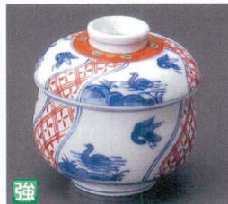
125-13-2F3 2,300円 1925269002 万暦むし碗 (8.3φ×8.5H)