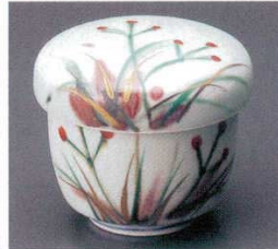
125-09-1K3 2,600円 1917110023 乾山南天むし碗 (7.7φ×6.6H)