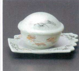
125-34-6F3 2,600円 1965110004 ヒワ釉武蔵野姫蓋物 (9.5×8.2×8H)