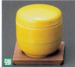
125-26-6F3 2,850円 1965110002 黄釉グリーン線夏目むし碗 (8φ×8H)