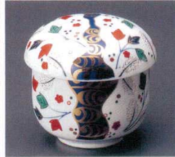
125-04-2A3 2,900円 2021123011 錦流水木葉むし碗 (8.3φ×8.8H)