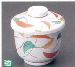
125-11-1B3 2,450円 2312125011 唐草ハケメ京型蒸し碗 (7.6φ×8.8H)