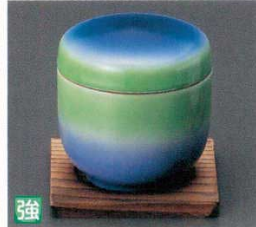
125-28-6F3 2,650円 1965110025 二色吹夏目むし碗 (7.8φ×7.8H)