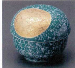
125-10-6F3 2,500円 1965110030 グリーン武蔵野むし碗 (9.2φ×8.4H)