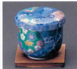
125-22-6F3 2,650円 1965110010 タミ松竹梅むし碗 (8.6φ×8H)