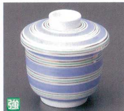
125-12-1B3 2,400円 2312125012 ブルー胸筋京型蒸し碗 (7.5φ×8.5H)