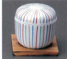
125-30-6F3 2,300円 2165140030 菊形十草むし碗 (8φ×8H)