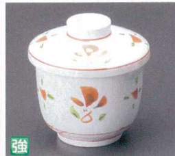
125-14-1B3 2,260円 2312125014 花つばみ京型蒸し碗 (7.5φ×8.5H)