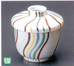
125-01-2F3 3,900円 1925109006 銀彩五色十草京形むし碗 (7.6φ×8.5H)