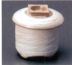
125-03-6A3 2,920円 2361125003 手造粉引刷毛目むし (7.5φ×9H)