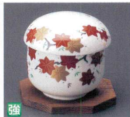
125-20-6F3 3,000円 2065123027 春秋むし碗 (9φ×9H)