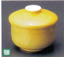
125-02-6F3 3,000円 1965109016 黄釉グリーン乱線大むし碗 (9.8φ×8.5H)