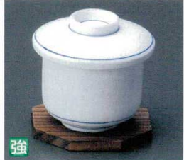
126-22-6B3 1,600円 1962112014 呉須筋むし碗 (8.2φ×8.8H)