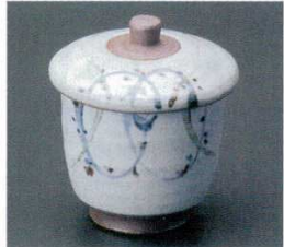
126-15-1B3 1,600円 1912111026 唐津やなぎむし碗 (7.4φ×9.7H)