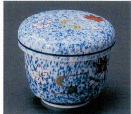
126-04-4B3 2,100円 1942111002 吹墨竜田川むし碗(大) (8.7φ×7.5H) 126-05-4B3 2,000円 1942111003 吹墨竜田川むし碗(小) (7.8φ×7H)