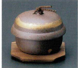
126-20-6F3 2,050円 1965111009 黄釉グリーン京むし碗 (8.3φ×8.5H)