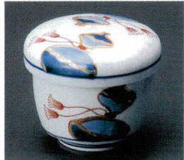
126-02-4B3 2,150円 2042126027 染錦ひさごむし碗(大) (7.5φ×7.5H) 126-03-4B3 2,000円 1942114031 染錦ひさご小むし碗 (6.8φ×7H)