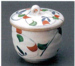
126-11-6E3 1,780円 2264129049 手描き赤絵唐草むし碗 (7.5φ×9.5H)