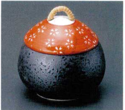
126-17-6B3 1,500円 2162142029 芝桜むし碗 (9.5φ×10.5H)