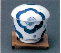
126-26-6F3 1,000円 1965112031 一珍梅むし碗 (9φ×8.5H)