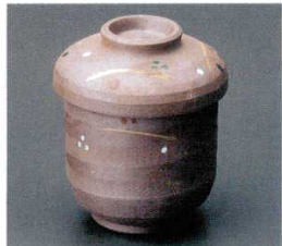
126-09-1B3 2,000円 2012125018 南蛮むさし野むし碗 (7.2φ×9.6H)