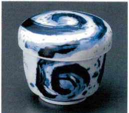
126-07-1K3 2,100円 1917111012 渦刷毛目むし碗 (7.7φ×7H)