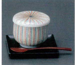
126-34-6F3 2,350円 1965110035 黄釉グリーン京むし碗 (8.3φ×8.5H) 126-35-6F3 1,000円 2065123022 受台(黒)ABS (11×11×1.3H) 126-36-6F3 280円 2065123026 朱スプーン (13.5×2.4)