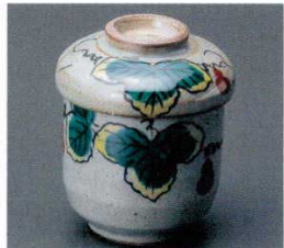
126-10-6A3 1,870円 2161141015 古染赤入瓢つた絵むし (7φ×9.5H)