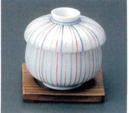
126-40-6F3 1,300円 2265131014 京十草腰丸形むし碗(中) (7.5φ×7.9H) 中 126-41-6F3 1,150円 2265131015 京十草腰丸形むし碗(小) (7φ×6.5H) 小 126-42-6F3 250円 1965110026 焼杉台 (8.5×8.5)