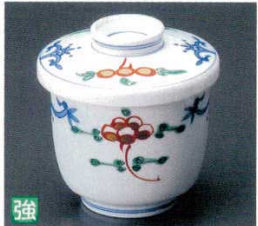
126-06-7F3 2,000円 2275130029 八祥むし碗 (7.8φ×9H)