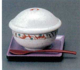
126-19-6F3 280円 1965110011 八角焼杉台 (11×11×1.3H)