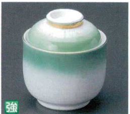
126-12-2A3 1,720円 2021122012 グリーン吹むし碗 (7.7φ×8H)