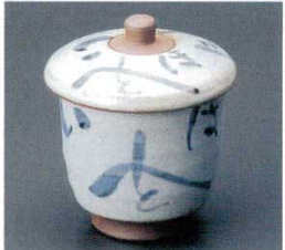
126-16-1B3 1,600円 1912111027 唐津イロハむし碗 (7.4φ×9.7H)