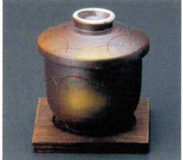
126-24-6F3 1,270円 2165143004 金吹むさしのむし碗 (8φ×8.5H)