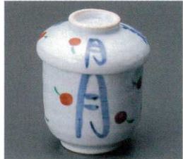
126-14-6A3 1,650円 1961111018 赤入雪月花むし碗 (7φ×9.5H)