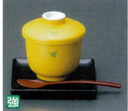
126-31-6F3 2,650円 1965110024 赤繪草花壺産物 (9.5φ×8.2φ×8H) 126-32-6F3 1,000円 2065123028 受台(紫)ABS (11×11×1.3H) 126-30-6F3 280円 2065123032 朱スプーン (13.5×2.4)