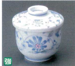
126-13-3H3 1,700円 1936311053 彩華むし碗 (8φ×9H)