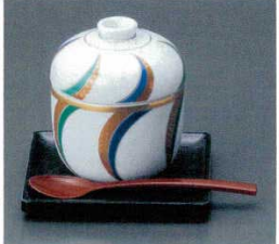
126-37-6F3 2,300円 1965110034 金彩ネリ模様のむし碗 (9.5φ×8H) 126-38-6F3 1,000円 2065123025 受台(黒)ABS (11×11×1.3H) 126-39-6F3 280円 2065123023 朱スプーン (13.5×2.4)