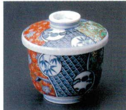
126-01-7F3 2,200円 1975111017 祥瑞吉野京型むし碗 (7.8φ×8.7H)

刺身用・小鉢・珍味 絵加和風・大皿・鉢 酒器・茶器 漆器・漆器 井・茶碗 急須・茶器 和園・オーソ 耐熱・萬古焼 洋食器・碗皿 中華食器 カブ入・金属 茶道具 漆器 木・竹製品 神・仏具