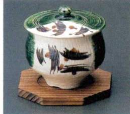
126-18-6F3 2,000円 2065123030 織部刷毛目むし碗 (8.5φ×9H)