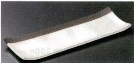
134-07-7E3 3,000円 2374134007 白黒長角スクエア(M) (30.3×10.9×2.5H)