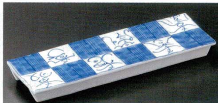
134-08-8F3 3,000円 2385134008 染付文字入市松ゲタ皿(中) (31×10×3H) 134-09-8F3 2,200円 2385134009 染付文字入市松ゲタ皿(小) (20.5×10×3H)