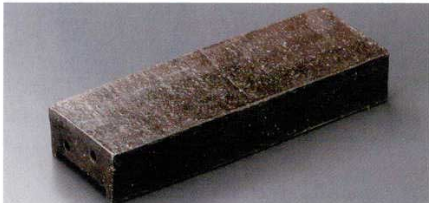
134-04-7E3 4,600円 2374134004 渋釉角柱皿 (26×9.2×4.5H)