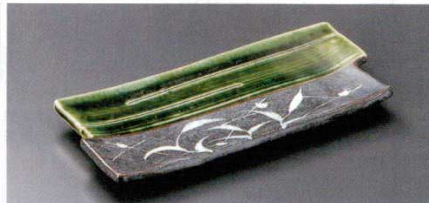
134-05-6B3 4,250円 2362134005 織部志野草花焼物皿 (25×12×2H)