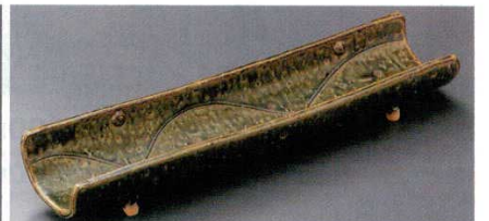
134-06-6F3 3,600円 2365134006 織部半月長角皿 (35×9×5.5H)