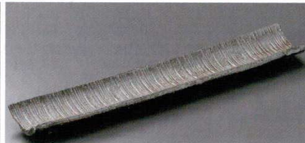
134-02-2F3 5,800円 2325134002 黒筋文竹割付出皿 (39.2×7×3.3H)