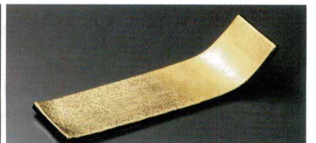
134-10-8F3 2,750円 2385134010 金彩片上り突出皿 (25.5×7.8×5H)