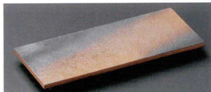
136-08-8F3 2,650円 2085130018 焼締吹付出皿 (23.2×9.6×2.4H)