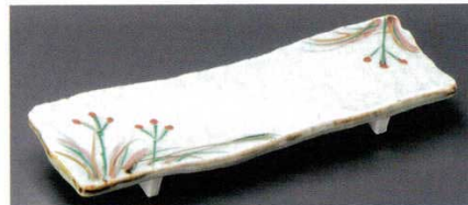
136-09-4B3 2,600円 1942118007 乾山南天まな板付出皿 (24.5×8.5×3.5H)