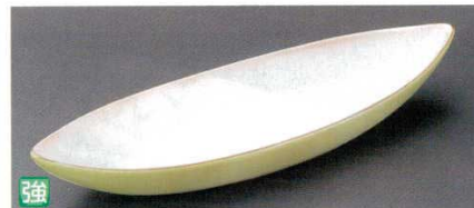
136-12-2A3 2,550円 2321136012 二色吹前菜鉢 (23×7.2×3.4H)