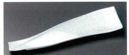
136-17-6F3 2,500円 2365136017 銀彩ラスタ-付出皿 (31.5×11.5×2H)