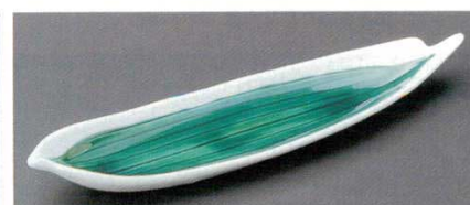
136-19-7C3 2,400円 1973118019 笹形付出皿 (24.7×7×3.6H)