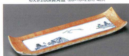
136-18-6F3 2,450円 1965118015 朱金彩手描き山水付出皿 (27.3×7.8×2.5H)