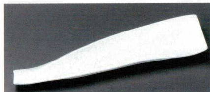
136-11-1A3 2,580円 2211139014 風前菜皿 (31×11.4×2H)