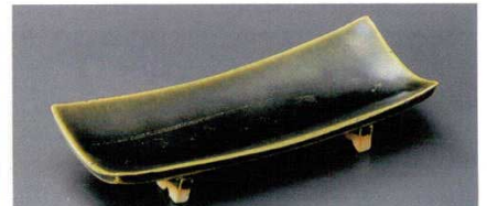
136-13-6F3 2,550円 2065131016 織部足付長角皿(小) (16.5×7×2H)