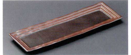
136-07-6F3 2,800円 2385136007 鉄釉ラスタ-段付長皿 (33.3×11.5×2.5H)