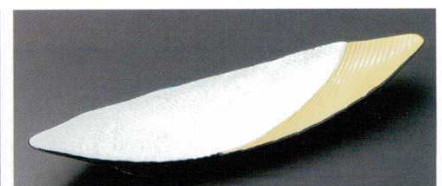
136-20-8F3 2,400円 2385136020 金銀彩彫33cm舟形皿 (33×10.5×4H)