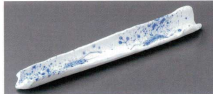
136-06-6F3 2,800円 2265139008 染付変り竹型皿 (30.5×4×2.8H)