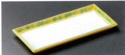
136-01-6F3 2,900円 2385136001 黄小花突出皿 (25.2×12×2.2H)

和食器 焼皿 和皿 大皿 盛鉢 漆器 漆器 漆器 和陶 フーテン 耐熱 陶器 洋食器 碗皿 中華食器 ガラス・金属 茶道具 雑器 木竹製品 神仏具