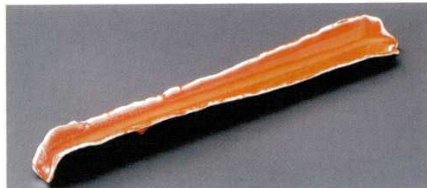
136-05-6F3 2,800円 2265139009 変り竹型辰砂皿 (31×4×3H)