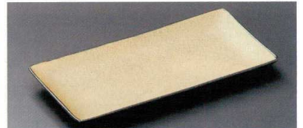
136-10-6F3 2,580円 2385136010 たまも 24cm長角皿 (24.8×12.8×2.3H)