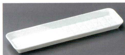
136-14-6E3 2,150円 2364136014 もえぎ30cm細長角皿 (30×8×2.2H) 40入 136-15-6E3 2,500円 2364136015 もえぎ28cm長角皿 (28×10×2.2H) 40入