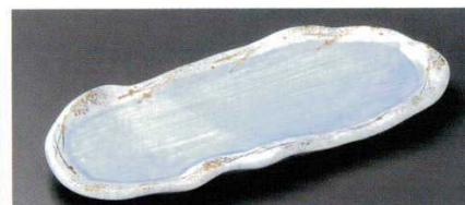
136-16-1K3 2,500円 1917118017 湖水長皿 (24.6φ×10.8×2.5H)