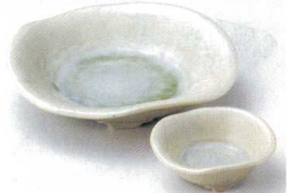
014-09-6F3 1,480円 1965017015 ピード口三ツ足向付 (18.7φ×4H) 014-10-6F3 530円 1965017016 ピード口三ツ足千代口 (9.5φ×3.5H)