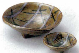
014-17-2F3 1,430円 1925017013 灰釉格子刺身鉢 (15.4×15×5H) 014-18-2F3 770円 1925017014 灰釉格子千代口 (8.5φ×3H)