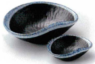
014-15-6E3 1,450円 2364014015 銀河帯まゆ型向付 (17.5×12.5×6H) 40入 014-16-6E3 480円 2364014016 銀河帯まゆ型千代口 (10×7.5×3.5H) 80入