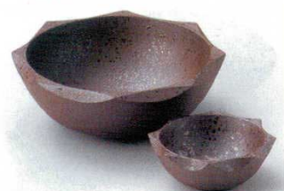
014-25-1B3 1,450円 1912017021 南蛮八角刺身鉢 (13.6×4.8H) 014-26-1B3 720円 1912017022 南蛮八角千代口 (7.6×3.1H)