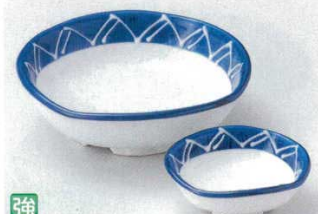
014-39-2A3 1,380円 2321014039 一珍清流刺身鉢 (15.3×15.2×4.7H) 014-40-2A3 580円 2321014040 一珍清流千代口 (8.9×8.9×3.2H)