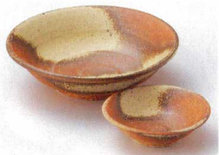
014-05-3B3 1,500円 2132017029 伊賀火色向付 (15.8φ×4.3H) 014-06-3B3 720円 2132017030 伊賀火色千代口 (9.5φ×2.5H)