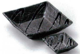
014-23-1B3 1,430円 2112018013 黒オリベ流し正角鉢 (16.4×16.4×3.8H) 014-24-1B3 480円 2112018014 黒オリベ流し正角千代口 (7.9×7.8×2.8H)