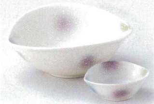
014-13-6F3 1,450円 2065014033 三色吹笠形刺身 (16.5×13.5×6.5H) 中国 014-14-6F3 470円 2065014034 三色吹笠形千代口 (8.5×6.7×3H) 中国