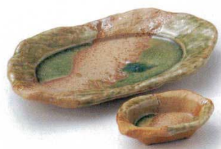
014-19-1B3 1,430円 1912017019 オリベ石庭刺身鉢 (22×12.6×2.8H) 014-20-1B3 570円 1912017020 オリベ石庭千代口 (9.6×6.5×2.6H)