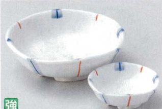
014-27-2A3 1,400円 2221016001 二色十草刺身鉢 (15.6×15.1×4.7H) 014-28-2A3 580円 2221016002 二色十草千代口 (8.9×8.9×3.3H)