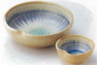
014-11-6E3 1,480円 2264015031 御深井刺身鉢 (15.4φ×5H) 014-12-6E3 650円 2264015032 御深井千代口 (8.1φ×3.7H)