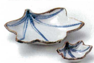
014-33-7C3 1,400円 1973017017 古染八ツ手向付 (19×17×4H) 014-34-7C3 500円 1973017018 古染八ツ手千代口 (8.5×7.5×3H)