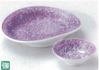
014-01-6F3 1,500円 2165018019 雪化粧小判型向付 (17×4.5×4H) 014-02-6F3 750円 2165018020 雪化粧六兵衛丸千代口 (8.5φ×3H)

刺身 向付小鉢 珍味 紋頭和頭 和頭 酒器 煮物 そば 丼 茶碗 急須 茶器 和陶 オーブン 耐熱 萬古焼 洋食器 碗皿 中華食器 ガラス 金属 茶道具 雑器 木竹製品 神・仏具