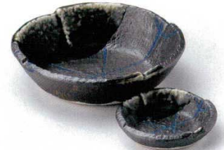
014-21-2A3 1,400円 2221014035 南蛮乱十草刺身鉢 (14.9φ×4H) 014-22-2A3 450円 2221014036 南蛮乱十草丸千代口 (8.4φ×2H)