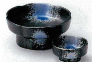
014-37-1K3 1,400円 1917017037 いそべ高台刺身鉢 (16.4φ×7.2H) 014-38-1K3 580円 1917017038 いそべ高台千代口 (8.8φ×4.2H)