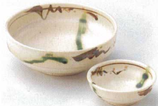
014-31-6B3 1,400円 1962017005 弥七田織部刺身鉢 (12.7φ×5H) 014-32-6B3 680円 1962017006 弥七田織部千代口 (7.5φ×3H)