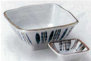
014-35-1K3 1,400円 2017017022 手描民芸古染6.0刺身鉢 (16×16×6.5H) 014-36-1K3 430円 2017017023 手描民芸古染正角千代口 (8.5×8.5×3H)