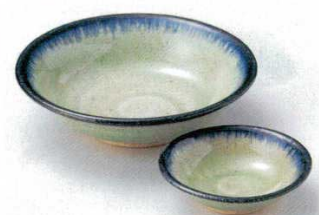
014-29-7F3 1,400円 2275016025 土物若草流向付 (16φ×4.3H) 014-30-7F3 650円 2275016026 土物若草流千代口 (9.8φ×2.8H)