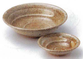
014-07-3B3 1,500円 2132017027 土灰釉向付 (15.8φ×4.3H) 014-08-3B3 720円 2132017028 土灰釉千代口 (9.5φ×2.5H)