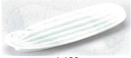
142-16-1B3 1,160円 2312142016 青白磁流葉付出皿 (24.6×7.8×1.8H)