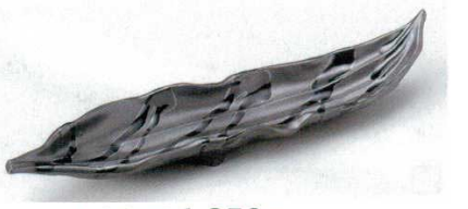
142-12-5E3 1,250円 2354142012 黒織部流し葉ラン長皿 (29.3×6.3×4.2H)