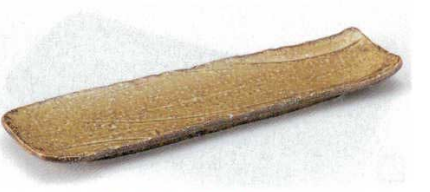
142-06-6B3 1,280円 2262144005 不動荒瀬型長皿 (36×9.5×2.8H)