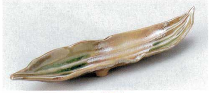
142-10-5E3 1,250円 2354142010 織部葉ラン長皿 (29.3×6.3×4.2H)