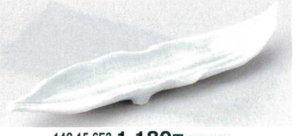
142-15-6E3 1,180円 2364142015 青白磁葉ラン長皿 (29.3×6.3×4.2H) 50入