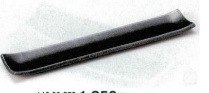
142-09-8F3 1,250円 2285144010 黒ゆず11.0細長皿 (34×6×1.5H)