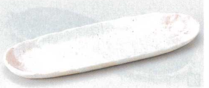
142-02-1K3 1,300円 2117169021 桜志野9.5細型小判皿 (10×28.8×2H)