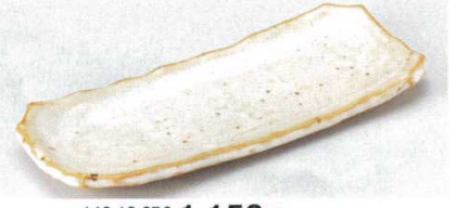
142-18-3B3 1,150円 2332142018 うのふ焼物皿 (26×10.8×2.3H)