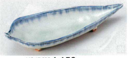
142-17-6B3 1,150円 1962122006 御深井葉型付出皿 (27×10.5×4.8H)