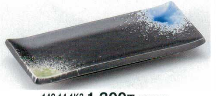
142-14-1K3 1,200円 1917122008 いそべ付出皿 (22.7×10×3H)