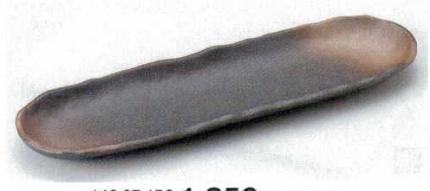
142-07-1B3 1,250円 1912120014 備前風付出皿 (27.6×8.2×2.1H)