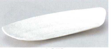
142-11-8F3 1,250円 2085135016 白日夢波型変型焼物皿 (28.5×11)