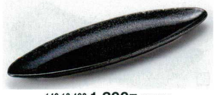
142-13-4C3 1,200円 2343142013 黒柚楕円皿 (23×10.3×2.3H)