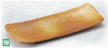
142-03-1A3 1,280円 2311142003 黒藤付出皿 (22.9×8.7×2H)