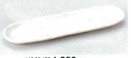
142-08-1B3 1,250円 2012135003 粉引付出皿 (27.6×8.2×2.1H)