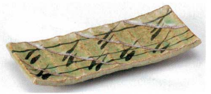
142-05-2F3 1,280円 1925122001 灰柘格子付出皿 (21.8×9.2×2.2H)