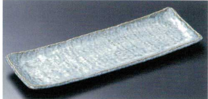
148-03-4A3 3,200円 1941124003 露さんま皿(大) (37.5×13×3H) 148-04-4A3 1,850円 1941124004 露さんま皿(小) (30×12.5×2.5H)