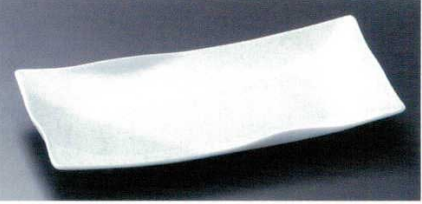
148-06-6E3 2,700円 2134175006 青白磁長角大皿 (28×14×3.4H)