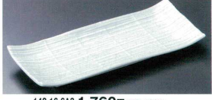
148-16-6A3 1,760円 2261150016 青磁すだれ 9.0細長角皿 (27×11.5×2.5H)