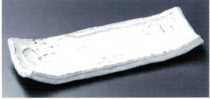
148-05-2K3 3,000円 2327148005 粉引彫31cm長角皿 (31×11.5×3.9H)