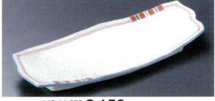
148-11-6F3 2,150円 1965209019 赤絵十草長皿 (30.5×13×3H)