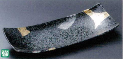
148-02-6A3 3,450円 2161175003 黒ちらし金銀ちぎり10.0長角細皿 (29×11.5×4H)