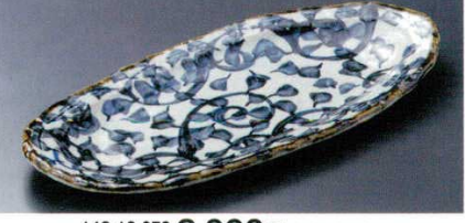
148-12-6F3 2,000円 1965124006 タコ唐草ダエン長盛皿 (32×15×3H)