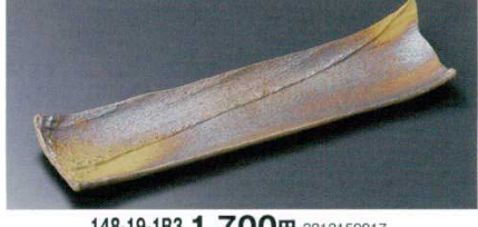
148-19-1B3 1,700円 2212150017 美膳しぶき長皿 (33.7×10×1.4H)