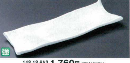
148-18-6A3 1,760円 2261150014 青白磁 ちぎり 11.0皿 (34×12.5×3.5H)