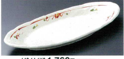
148-14-1K3 1,760円 2317148014 東山赤絵11.0舟型皿 (33.3×13.1×3.8H)