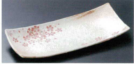
148-07-3B3 2,300円 2132166006 平安桜長焼皿 (29.8×13×3.5H)