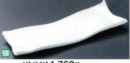
148-15-6A3 1,760円 2261150015 白釉 ちぎり11.0皿 (34×12.5×3.5H)