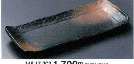
148-17-2C3 1,700円 2323148017 緋色焼物皿 (33.5×14.5×3.5H)