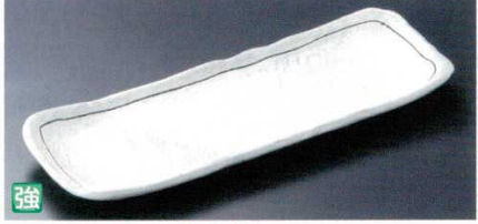
148-08-6A3 2,310円 2161175009 粉引(線彫)長角さんま皿 (30.5×11.5×3H)