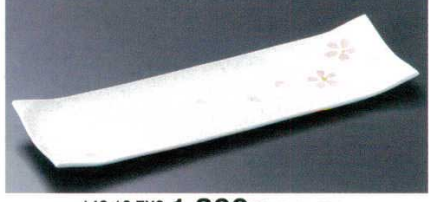
148-13-7Y3 1,800円 2378148013 万古焼花柄長皿 (31×9×2H) 1入