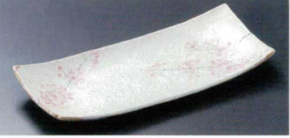
148-09-2B3 2,300円 2322148009 しろやま桜長皿 (29.3×13.4×4H) 40入