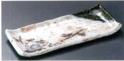
149-01-2F3 1,700円 2125161001 織部古木焼物皿 (26×11.5×2.5H)