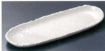
149-08-2B3 1,600円 2222151011 白押花サンマ皿 (30.2×11.5×2.2H)