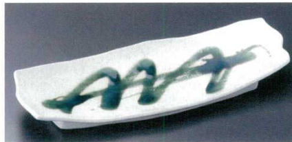
149-11-2F3 1,500円 1925124011 白マット織部散し長皿 (30×13×2.8H)