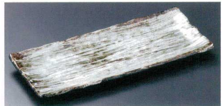
149-15-1K3 1,400円 2317149015 白刷毛均窯サンマ皿 (18.8×12.2×2.5H)