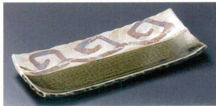
149-05-2B3 1,600円 2322149005 志野織部唐草長角サンマ皿 (28.5×12.5×3H) 60入