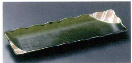
149-18-5E3 1,350円 1954124015 織部十草長皿 (32.5×11.5×3H)

和食器 焼皿和皿大皿盛鉢 湯呑茶碗 井茶碗 急須茶器 和陶オーブン 耐熱磁器焼 洋食器 磁器 中華食器 ガラス食器 茶道具 雑器 木竹製品 神・仏具