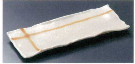
149-03-1A3 1,620円 2211151001 火ダスキ長皿 (29.8×12×2.4H)