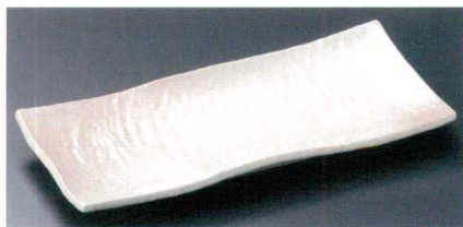
149-16-6A3 1,380円 2261151017 桜志野さんま皿 (28.5×13×3.5H)