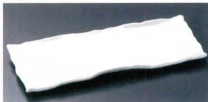
149-13-1A3 1,530円 2211151002 砂嵐長皿 (29.8×12×2.4H)