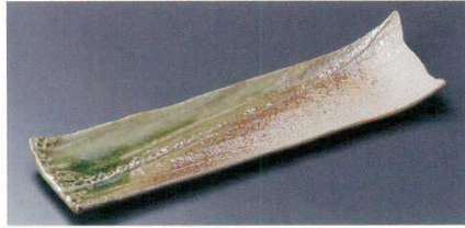
149-02-1B3 1,700円 2212150018 青白磁しぶき長皿 (33.7×10×1.4H)