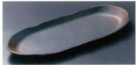
149-06-3B3 1,600円 2132176008 備前吹楕円長皿 (34.5×13×3H)