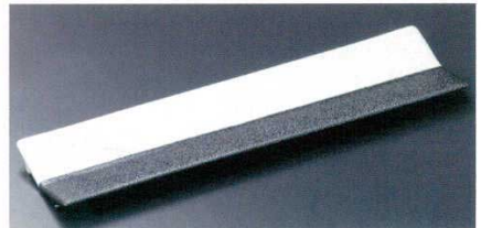
149-09-8F3 1,600円 2185152015 矢羽根32cm長皿 (32.5×8.5×2.5H)