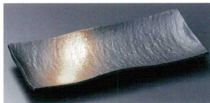
149-17-6A3 1,380円 2261151016 いぶし備前さんま皿 (28.5×13×3.5H)