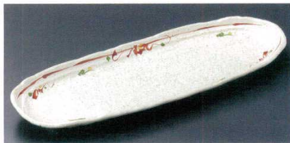
149-04-1K3 1,670円 2317149004 東山赤絵11.0楕円長皿 (33.3×12.1×3H)