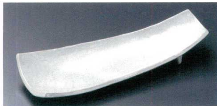
149-10-2A3 1,600円 2221158006 煌めき真珠反型焼き物皿 (18.7×11.3×5.3H)