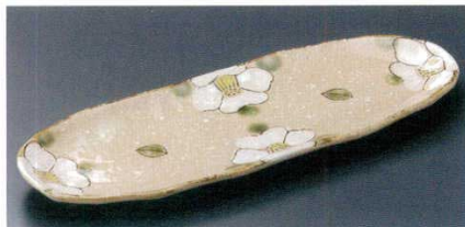
149-07-3B3 1,600円 2132176009 織部椿楕円長皿 (31×11×2.5H)