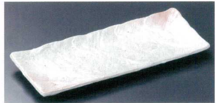
149-12-1K3 1,500円 2117176014 桜志野9.5サンマ皿 (12.5×28.8×2.5H)