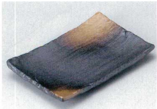
159-05-8F3 1,250円 2385159005 金茶吹き濃焼物皿 (22×14.5×2.5H) 159-06-8F3 580円 2385159006 金茶吹き濃串皿 (17×12×2H)