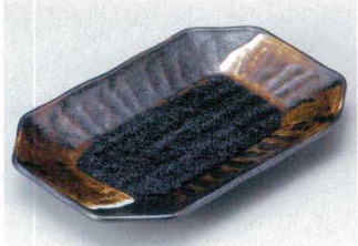
159-01-5E3 1,260円 2254600012 黒結晶白刷毛八角型多用皿 (24.3×16×2.5H)