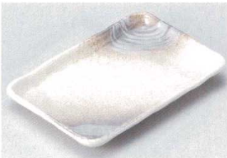
159-20-2B3 970円 2322159020 かすみ志野7.0長角皿 (21×14×2.5H) 80入 159-21-2B3 450円 2322159021 かすみ志野6.0長角皿 (17.3×12×2H) 80入