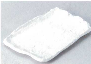
159-22-7F3 950円 2275160009 荒ノギ22cm焼物皿 (22×15×2H)