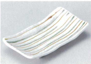
159-16-7Y3 1,000円 2378159016 美濃焼二色十草焼物皿 (21×11.5×3H) 1入