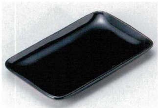
159-19-6A3 970円 2361159019 天目6.5撫角皿 (19×12×1.5H)