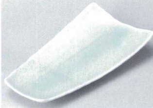
159-03-6F3 1,250円 2065148002 青白磁線紋長角皿 (21.5×11.5×3.2H)