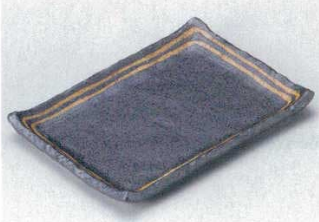
159-02-2B3 1,300円 2322159002 黒ライン7.0長角皿 (20.3×14.3×2.3H) 60入