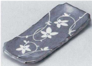
159-09-1E3 1,200円 2214160002 嵐志野唐草焼物皿 (26×10.6×2H)