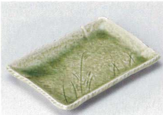
159-12-3A3 1,150円 2331159012 灰袖手彫アン7.0長角皿 (20×14×2H)