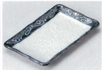
159-18-4A3 970円 2141160007 一珍7.0長角皿 (20.2×12.5×2H)