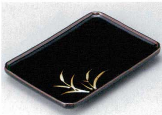
159-17-2A3 1,000円 2021148012 天目芦8.0焼物皿 (20.7×14.2×2.4H)