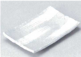
159-07-8F3 1,250円 2385159007 堀川濃焼物皿 (22×14.5×2.5H) 159-08-8F3 580円 2385159008 堀川濃串皿 (17×12×2H)