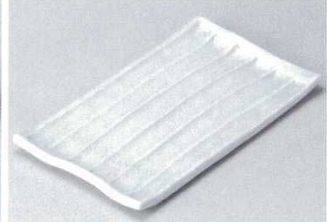
159-04-8F3 1,250円 2285159005 青白磁そぎ長角皿 (22.5×13.3)