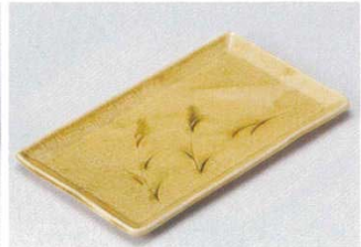
159-14-7C3 1,000円 1973133024 黄瀬戸芦焼物皿 (22×13×1H)