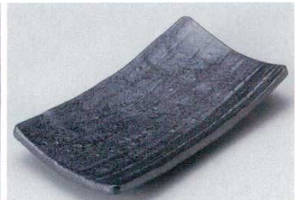
159-23-2C3 940円 2323159023 南蛮焼物皿 (22×12×3.5H)