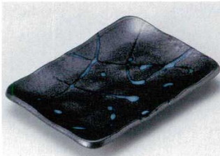
159-13-2A3 1,150円 2221145012 黒潮7.0板皿 (19.5×12.5×2.4H)