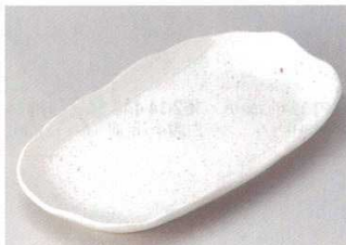
161-10-6F3 600円 2166173012 白釉楕円皿 (22.5×13×2.5H)