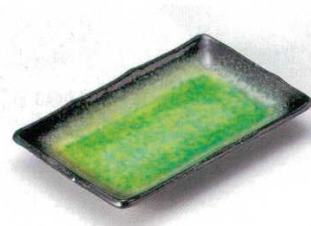
161-11-8F3 650円 2385161011 有明7.0焼物皿 (21×13×3H)