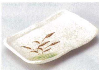
161-18-2K3 400円 1927135008 粉引アシそぎ型焼物皿 (21×13×2.8H)