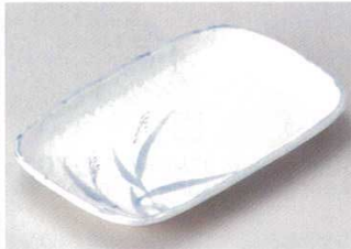
161-06-4A3 620円 1941134015 青磁アシ7.0小判皿 (20.7×13.5×2.8H)