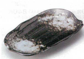
161-14-6H3 450円 2166173002 黒多用焼物皿 (21.8×12.5×2.7H)