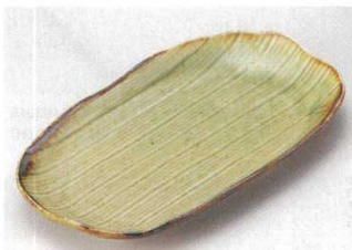
161-09-6F3 600円 2065151002 潤錆灰袖楕円皿 (22.5×13×2.5H)