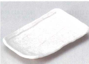
161-15-8F3 440円 2285162015 白釉そぎ7.0焼物皿 (21×13.5)