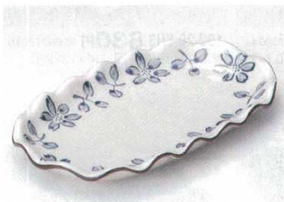
161-13-1E3 730円 2314161013 クレマチスフリル焼物皿 (21.2×12.3×2.3H)