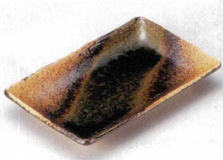
161-01-2F3 700円 1925134008 石焼織部焼物皿 (21×13×3H)

和食料理に最適 焼皿和皿大皿盛鉢 食器が彩る江戸 井茶碗 急須・茶器 和陶オーブン 耐熱・風呂焼 牙島器 磁器 中華食器 ガラス・金属 茶道具 磁器 木竹製品 押し紙