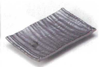
161-08-6F3 600円 2365161008 いぶし黒焼物皿 (20.7×13×3H)