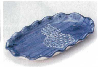
161-12-1E3 820円 2314161012 藍染フリル焼物皿 (21.2×12.4×2.3H)