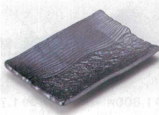
161-03-2K3 740円 2327161003 黒染焼物皿 (20.7×14×2.6H)