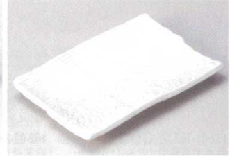
161-04-2K3 740円 2327161004 白染焼物皿 (20.7×14×2.6H)