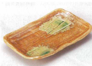
161-19-2K3 400円 1927135006 伊賀そぎ型焼物皿 (21×13×2.8H)