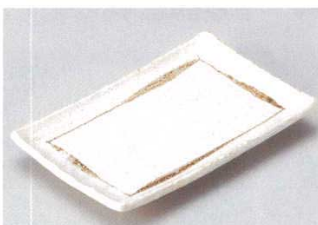
161-17-8F3 420円 1985135016 白マット7.0焼物皿 (20×13)