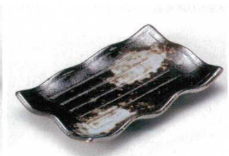
161-20-2K3 380円 2327161020 天目吹波型焼物皿 (20.5×12.5×3H)