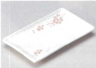
161-05-3B3 670円 2332161005 しだれ桜焼物皿 (18.5×11.2×2H)