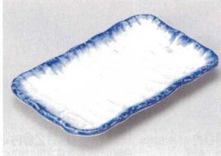
161-02-2F3 750円 1925134007 呉須刷毛焼物皿 (21.5×13.5×2.6H)