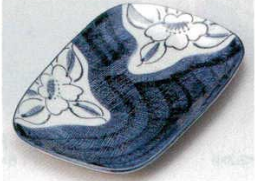
162-24-6H3 600円 2266272017 山茶花長角皿 (17.2×12×1.7H)