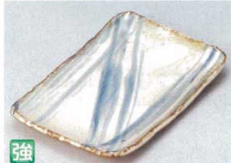
162-16-6A3 880円 2161235006 黒土白うのぶごすハゲ5.5長角皿 (16×11.5×2H)