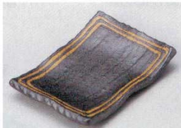
162-07-2B3 1,100円 2322162007 黒ライノ6.0長角皿四ツ足皿 (16.5×11.7×2.7H) 60入