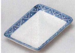
162-28-3C3 450円 1933135014 一珍末広6.0長角皿 (17.2×11.6×2H)