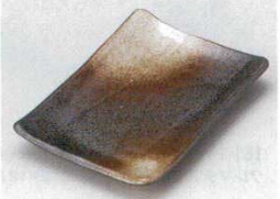
162-25-6H3 580円 2366162025 白吹天目串皿 (16.4×11×2H)