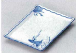
162-26-6A3 550円 2261272020 かわせみ 4.5長角皿 (14×11×2H)