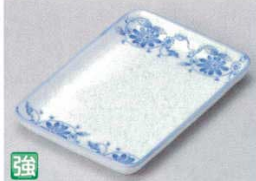
162-02-3H3 1,800円 1936311073 彩華長角皿 (17×12.2×1.8H)