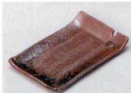
162-06-6B3 1,280円 2262272006 灰釉焼鳥皿 (14.5×9.7×1.8H)