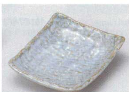
162-13-4A3 930円 1941175016 霞5.0長角皿 (15×12×3H)