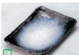
162-12-2A3 1,000円 2321162012 雲海5.5長角皿 (16×11.3×2.1H)