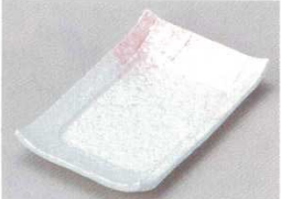
162-05-1B3 1,320円 2212272005 白磁ピンク吹長角四方皿 (16.4×10.2×1.8H)