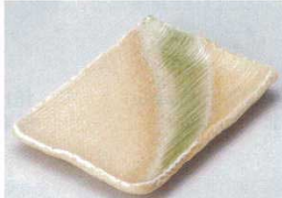
162-17-6H3 850円 2366162017 淵厚四角千筋利久取皿 (16.5×12×2H)