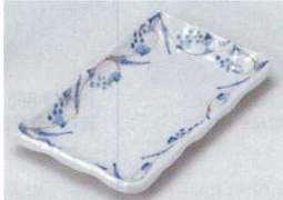
162-18-4A3 840円 1941139040 染付唐草6.0長角皿 (17.8×10.7×2H)