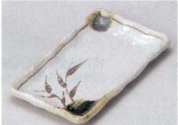
162-19-4A3 840円 1941139044 志野織部芦6.0長角皿 (17.8×10.7×2H)