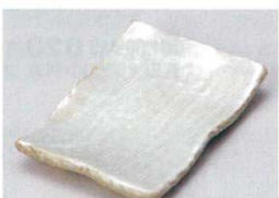
162-14-4A3 920円 1941133019 白雲4ツ足皿 (17×12×3H)