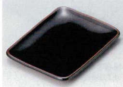
162-21-6A3 700円 2361162021 天目5.0揃角皿 (14.5×12×1.5H)