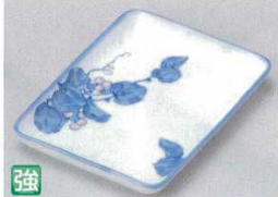
162-03-3H3 1,700円 2336162003 宴長角皿 (17×12.2×1.8H)