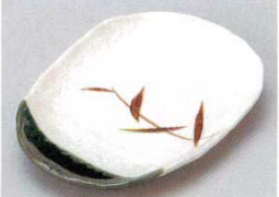
162-30-4A3 450円 2341162030 織部芦6.0楕円皿 (17.5×12.2×2.5H)