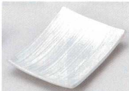
162-08-1A3 1,080円 2311162008 氷柱中皿 (17×12×2.8H)