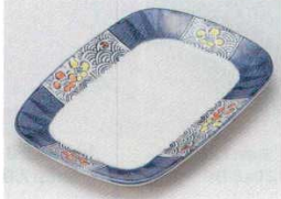
162-23-6H3 600円 2266272019 梅祥瑞長角皿 (17.5×12×1.7H)