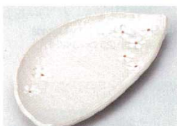
162-11-2B3 1,050円 2322162011 白押花半月皿(小) (9.5×11.3×2.5H) 80入