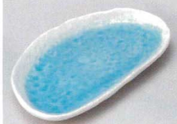
162-27-2B3 470円 2222273002 白流水半月皿(小) (18.5×10.5×1.7H)