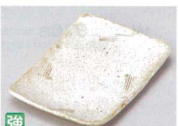
162-15-6A3 920円 2361162015 白唐津5.5長角皿 (16.5×11.5×2H)