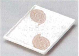
162-20-6H3 830円 2266272015 なごり葉荒波角皿 (16×13×2H)