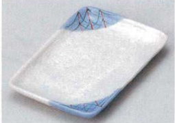
162-29-3C3 450円 1933135015 若竹6.0長角皿 (17.2×11.6×2H)