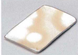
162-01-7E3 2,000円 2074202009 御本手長角皿 (17.5×11.8×1.3H)

刺身用小鉢 焼皿和皿大皿盛鉢 酒器茶器 和陶オーブン 耐熱 高古焼 洋食器 碗皿 中華食器 カフス 金属 茶道具 雑器 木竹製品 神仏具