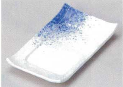
162-04-1B3 1,320円 2212272003 白磁ルリ吹長角四方皿 (16.5×10.2×1.9H)