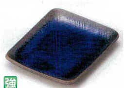
162-10-6A3 1,070円 2361162010 伊賀るり釉5.0揃角皿 (14.5×12×1.5H)