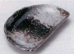
163-21-8F3 380円 2285273028 黒釉みに半月皿 (16.5×10.5)