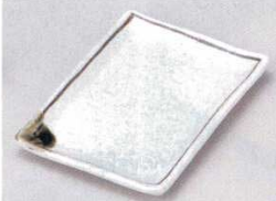
163-03-3A3 440円 2331163003 志野茶ライン6.0長角皿 (17.6×11.8×1.5H)