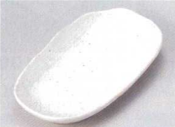
163-20-2C3 400円 2223273024 白袖千筋取皿 (16.5×9.5×2.5H)