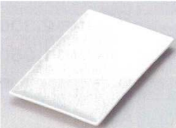
163-15-8F3 420円 2185240026 白袖串揚皿 (15.8×10.5)