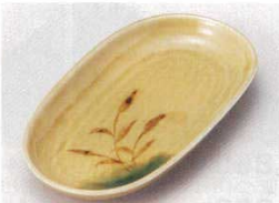
163-23-6H3 390円 2166241012 織部葦おかず皿 (18×10×2.2H)