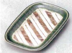
163-04-4A3 430円 1941135011 オリベ十章6.0小判皿 (17×11.5×1.5H)