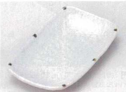
163-24-3A3 380円 2031207036 測点オリベ5.0長角皿 (17×9.5×1.8H)