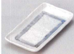
163-06-2B3 430円 2222273020 オフケ5.5長角皿 (18×10×2.3H)