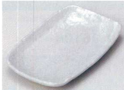
163-11-4A3 430円 2341163011 粉引白刷毛6.0長角皿 (17.5×12×2H) 163-12-4A3 410円 2341163012 粉引白刷毛5.0長角皿 (17.2×9.8×2.2H)