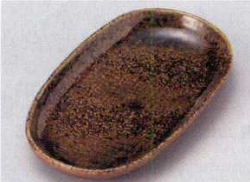
163-19-2A3 400円 1921145019 伊賀おかず皿 (17.7×9.8×2.1H)