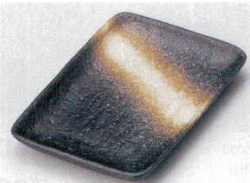
163-25-5C3 380円 2353163025 黒備前長角6.0皿 (17.8×12×2H) 120入