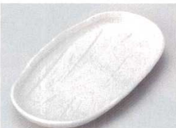
163-28-8F3 360円 2285273009 白釉小判おかず皿 (18×10)