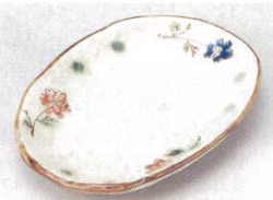
163-26-4A3 360円 2241273021 三つ花6.0小判皿 (18×12.5×2.5H)