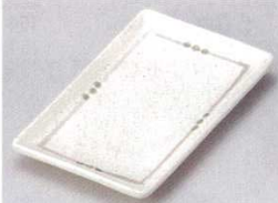
163-07-3B3 430円 2232273005 粉引ヒスイ串皿 (18.5×11.2×2H)