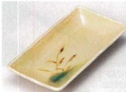
163-22-6H3 390円 2166240033 織部葦串皿 (18×9.5×2.4H)