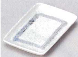
163-02-2B3 440円 2222273017 オフケ6.0長角皿 (17.5×12×2H)