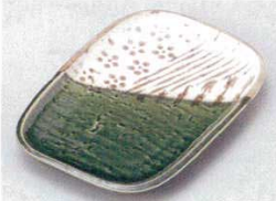
163-05-4A3 430円 1941135010 オリベ梅6.0小判皿 (17×11.5×1.5H)