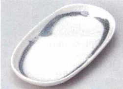
163-18-2A3 400円 1921145020 オフケおかず皿 (17.7×9.8×2.1H)