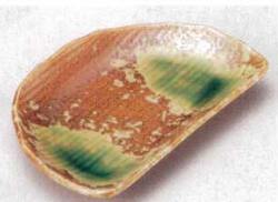
163-31-2K3 330円 2327163031 伊賀半月皿小 (16.5×10.5×2H)

割付のり付 漆皿和皿大皿盛鉢 酒器茶器 湯呑茶碗 井ノ茶碗 急須茶器 和陶オーブン 耐熱 薄古焼 洋食器 碗皿 中華食器 カラス 金属 漆道具 雜器 木竹製品 神・仏具