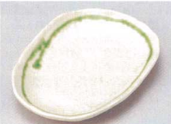
163-16-4A3 420円 2241273001 ヒワライン6.0小判皿 (17.5×12.2×2.5H)