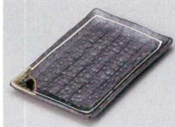
163-01-4A3 450円 2341163001 鉄袖一珍ライン6.0長角皿 (17.5×11.8×1.8H)