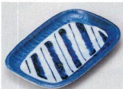
163-27-4A3 360円 1941145015 藍染十章6.0小判皿 (16.8×11.3×1.7H)