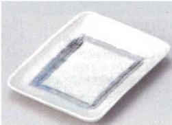
163-13-2B3 430円 2022207034 オフケ長角取皿 (11.5×15×2H)