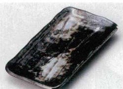
163-30-2K3 330円 2227273030 天目そぎ串皿 (18.2×9.8×2H)