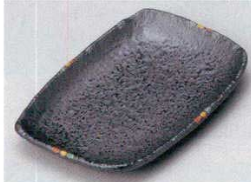
163-17-3A3 400円 2131173016 点あそび黒6.0長角皿 (17.5×12×1.5H)