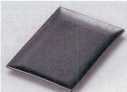
163-14-8F3 420円 2185240027 黒軸串揚皿 (15.8×10.5)