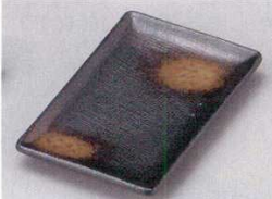
163-08-3B3 430円 2232273004 焼しめ串皿 (18.5×11.2×2H)