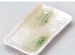
163-29-2K3 330円 2227273029 織部吹そぎ串皿 (18.2×9.8×2H)