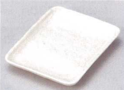
163-10-2B3 430円 2122241018 ミルクホワイト長角取皿 (12×15.5×2H)